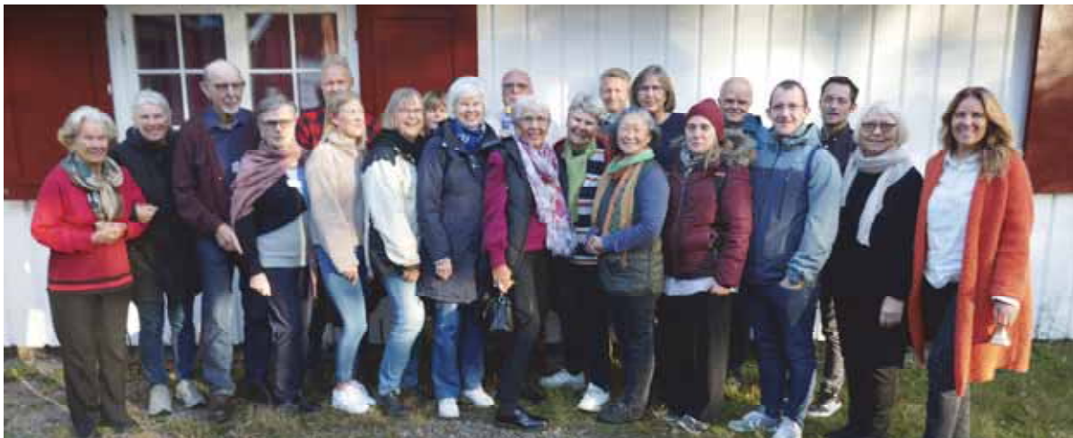
Deltagerne samlet utenfor Kjærrane sportskapell