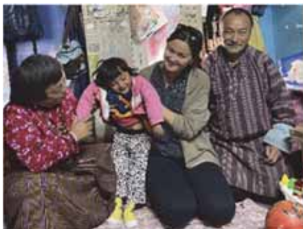
Jente som har glede av musikkterapi