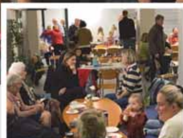
Julebasar (s 11)