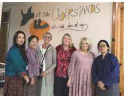
Medarbeidere i innføring av ICDP

I september 2023 fikk vi introdusere et foreldreveiledningsprogram (ICDP) som har vist gode resultater i Norge, og mange land også i Asia og Afrika. Vi har dyktige lokale medarbeidere som ivrer for dette, og ser at det er et viktig supplement landet trenger. Det er nytt for landet