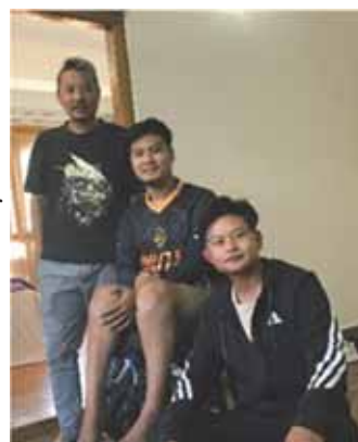
Karma prøver å få rullestolbrukere i arbeid

Vi er i gang med å bygge broer mellom kristne grupperinger. De trenger støtte både til sosialt arbeid og til en dypere opplæring i kristen tro.