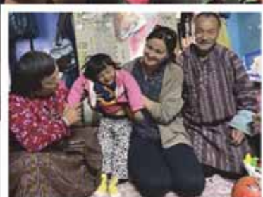
Bhutan (s 2)