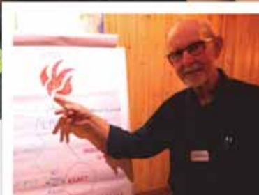
Alpha kurs (s 16)