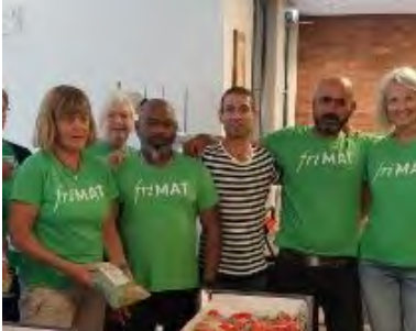
FriMat (s 8-9)