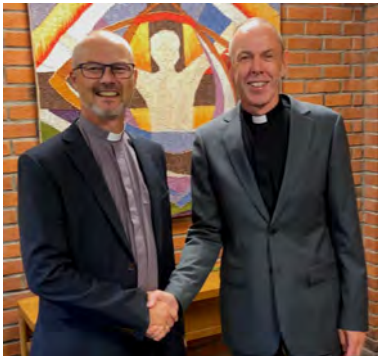
Ny hovedpastor (s 2-3)

Menighetsblad for Den Evangelisk Lutherske Frikirke, Kristiansand Menighet