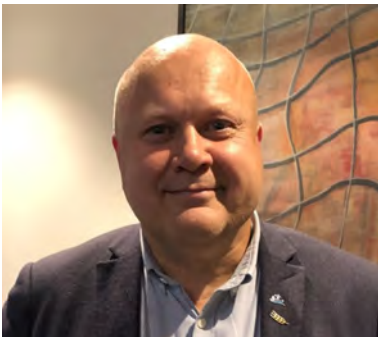
Dialogsamtaler (s 13)