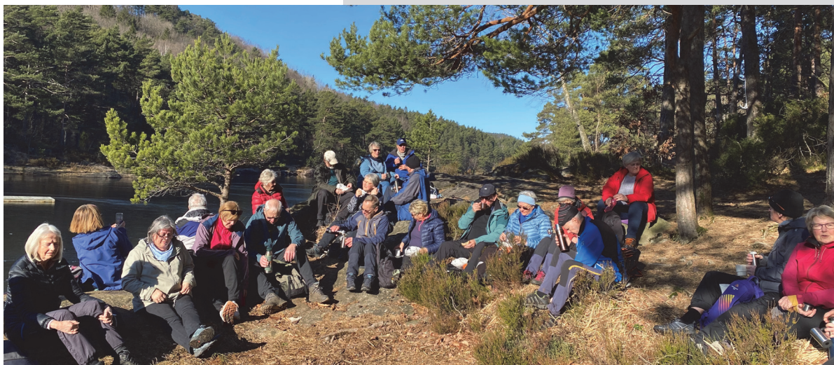
Solfylt pauseplass ved Indre Eigevann. Selv om det er nær bebyggelse var det mange som ikke hadde vært der før