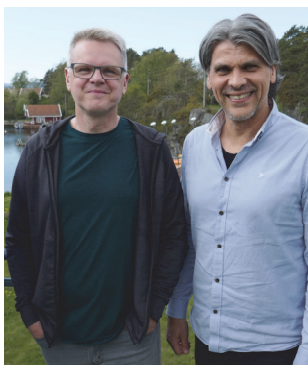
Frikirken overtar Kristiansand Folkehøyskole (s 4-5)

Menighetsblad for Den Evangelisk Lutherske Frikirke, Kristiansand Menighet