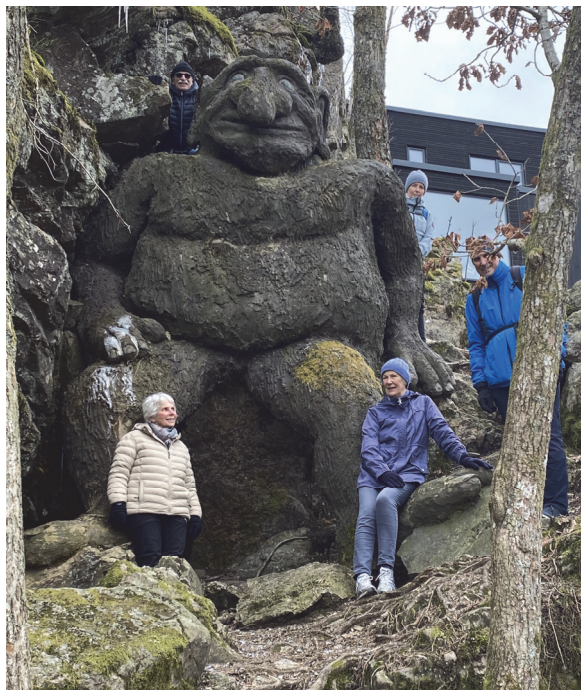
Nå skjønner vi hvorfor det heter Trollstien.

På turene har vi forsøkt å bidra med litt historisk og annen informasjon om stedet. Ved Kvernhusvannet fikk vi opplysninger om gammel steinalderboplass, og fikk påvist ruinene fra et gammelt ishus. I tidligere tider ble det skåret is som ble sendt med bår til utlandet. Det var før kjøleteknikkens tid. Ellers er området mye benyttet av fugleinteresserte.