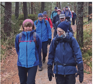
På tur med Kjerka (s 11-12)