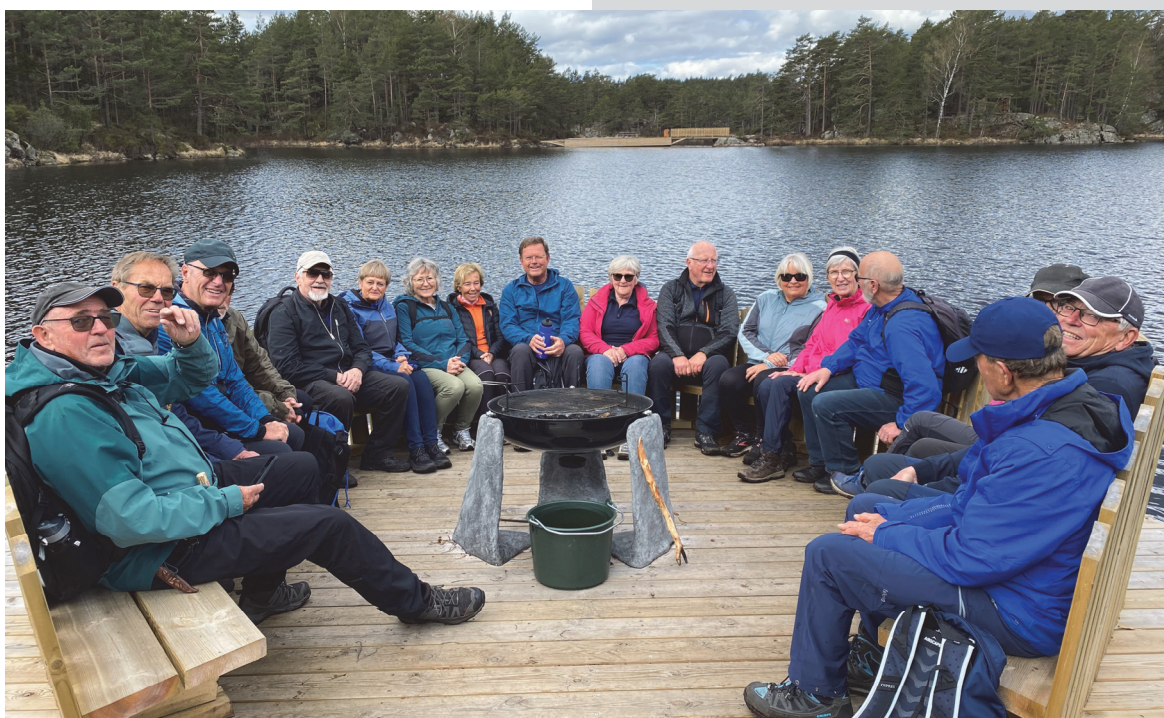
Flott tilrettelagt pauseplass ved Hamrevann.