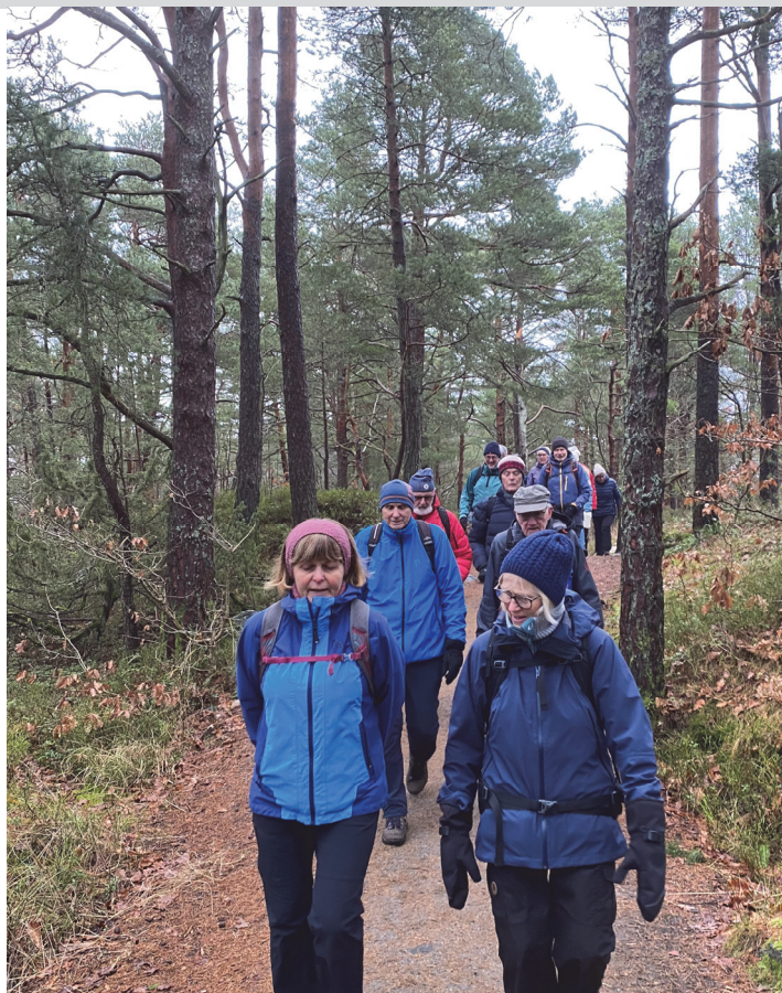
Gode stier rundt Kvernhusvannet

Det ser ut til at turopplegget er kommet for å bli.