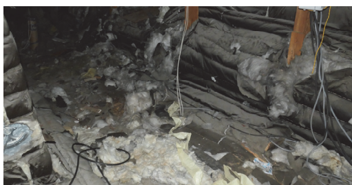
Loftet over kirkesalen