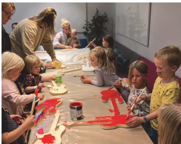
Gitarene skal males og senere pyntes med diverse stæsj.