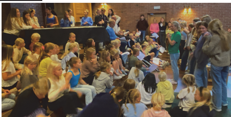
Her er et glimt fra en av øvelsene i kirka.

Etter en litt skuffende utsettelse i 2021 på grunn av pandemien er Like til Betlehem satt opp på nytt som årets juleforestilling i Kilden. Øvelsene er allerede i full gang, og vi har hatt den glede å kunne tilby kirken som øvingslokale til en entusiastisk flokk av unge forventningsfulle medvirkende. Det er tett program framover til premieren som er torsdag den 24. november. Det er lagt ut 8000 billetter og det meste er allerede utsolgt. Så vær