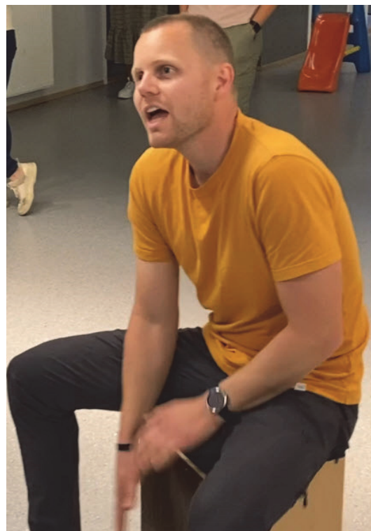
Nikolais trommeskole hører med til øvelsen.