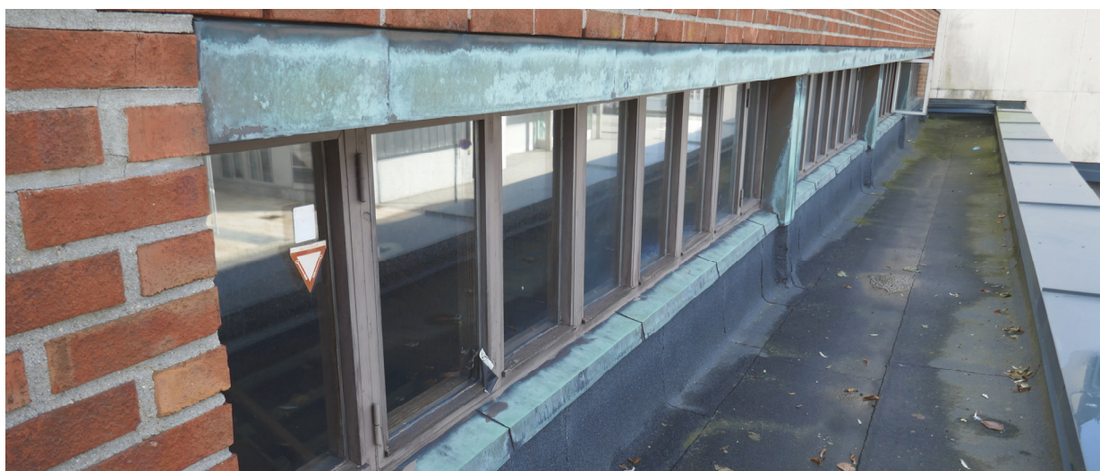
Vinduer i studentleiligheten mot Tollbodgata