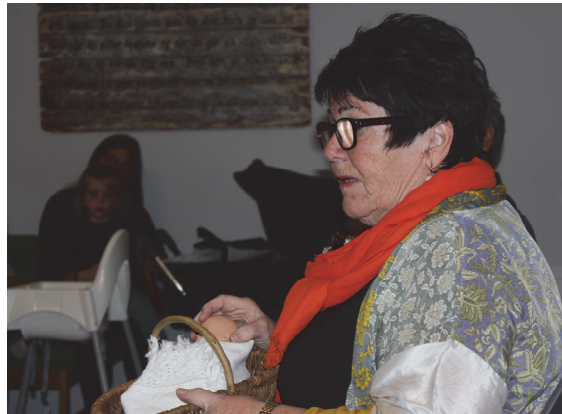
Kari Stabel forteller om Moses som ble funnet i en kurv i sivet.