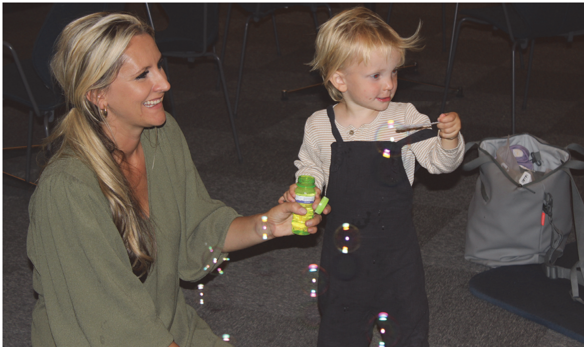
Det er få ting som er så gøy som såpebobler