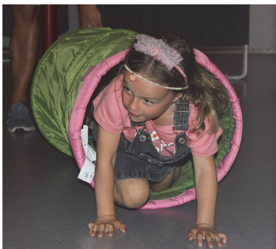
Hvor er neste hinder?