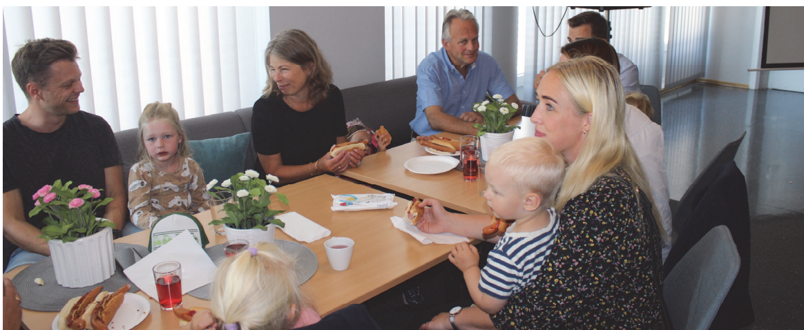
Fint å komme til ferdiglaget middag