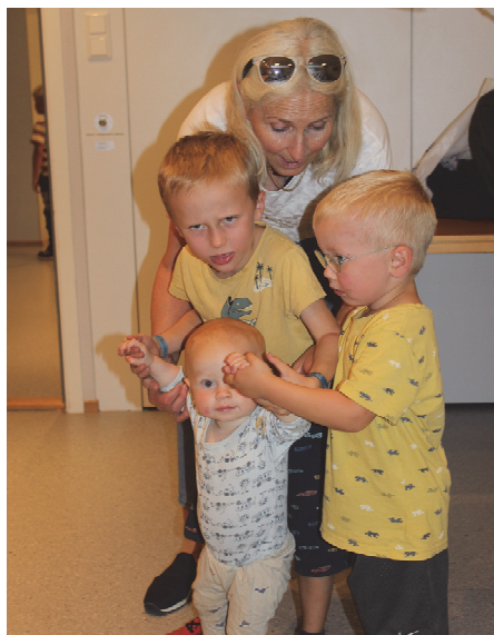
Det er viktig å passe på de aller minste