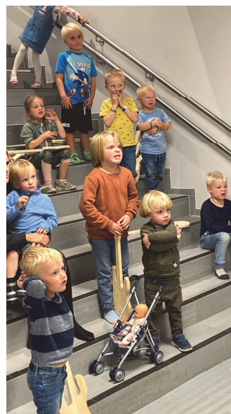
Oppvar- mingen er skikkelig se- riøs. Her gjelder det å lage mest mulig grimas- ser