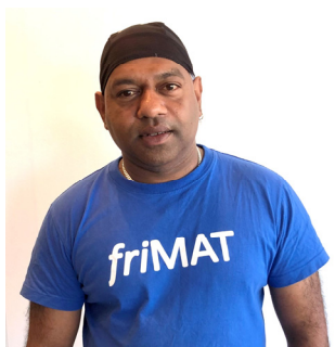
frimatgeneralen s 6-7

Menighetsblad for Den Evangelisk Lutherske Frikirke, Kristiansand Menighet