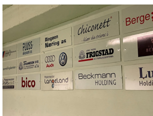
En god idé s 16