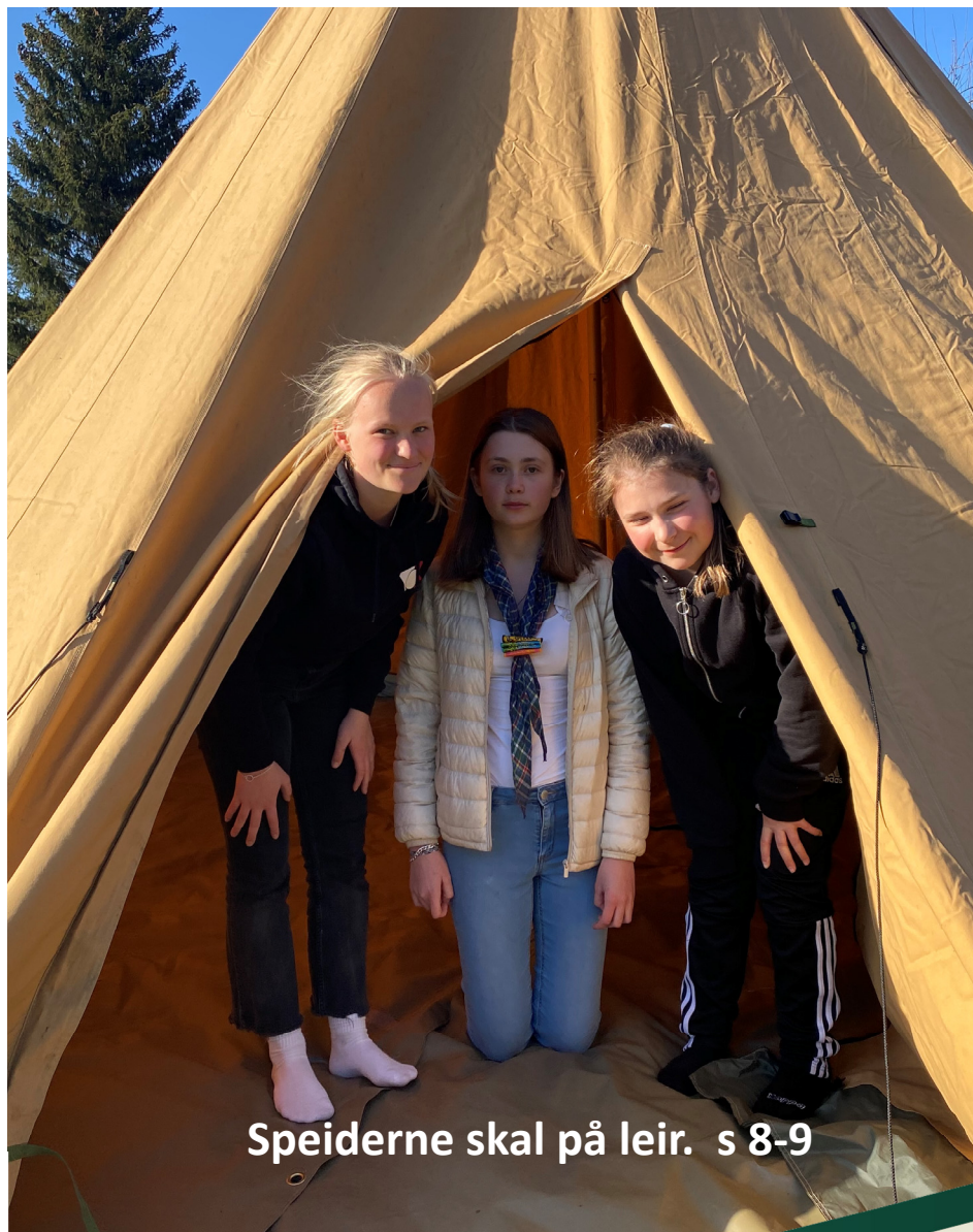
Speiderne skal på leir. s 8-9