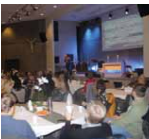
Menigheter beveger byen S 12