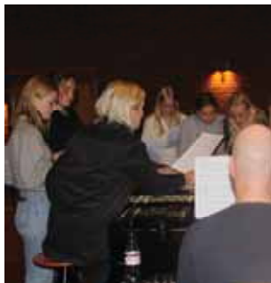
Ungdomskoret s 6

Menighetsblad for Den Evangelisk Lutherske Frikirke, Kristiansand Menighet