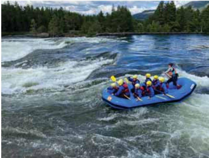
Rafting i Otra