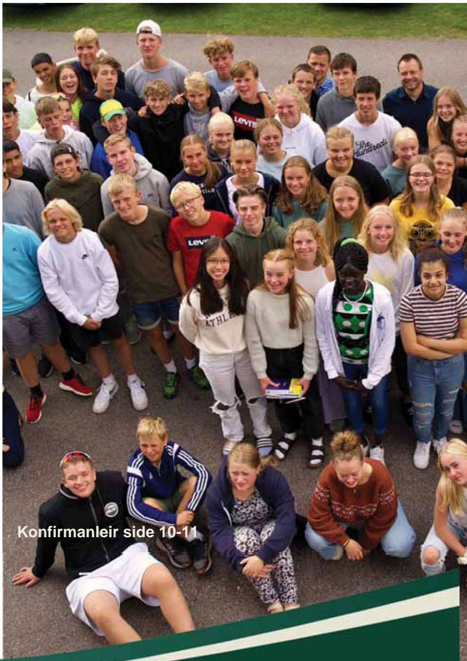
Konfirmanleir side 10-11