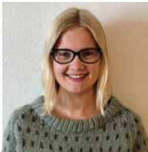
Barnelederen s 12