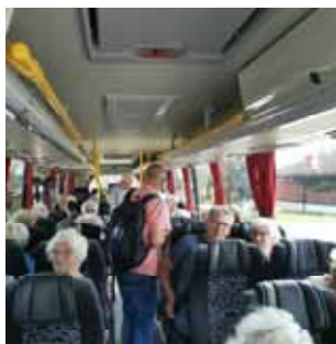
Seniortur s 4

Menighetsblad for Den Evangelisk Lutherske Frikirke, Kristiansand Menighet