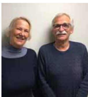
Besøktjenesten s. 6