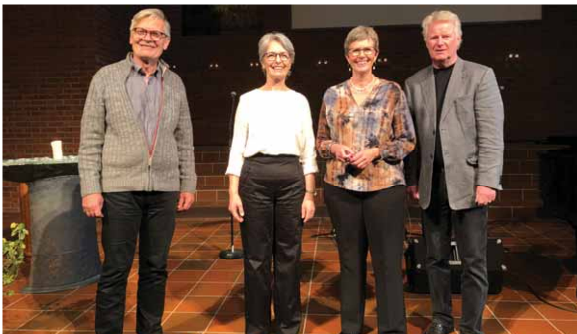
Misjonsmøte ble innledet med en minikonsert av sanggruppa Konfekt.