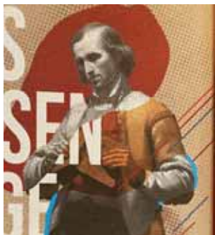
Hans Nilsen Hauge s 4-5

Menighetsblad for Den Evangelisk Lutherske Frikirke, Kristiansand Menighet