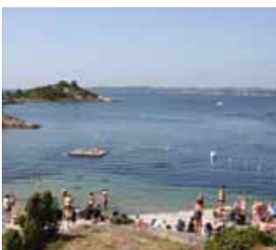
Sommer på Dvergsnestangen s. 14