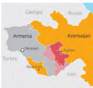
Konflikten i Armenia s. 10-11