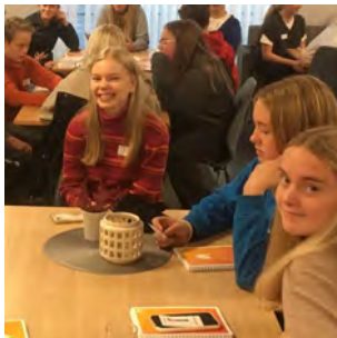
TØFF og VOX s. 6-7