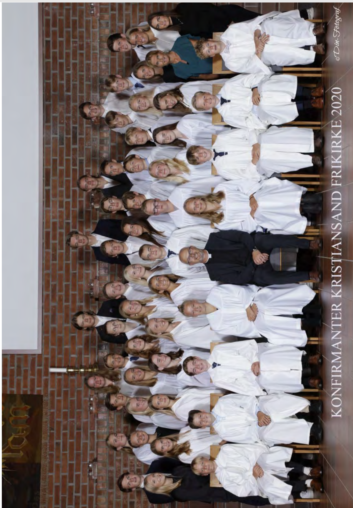
KONFIRMANTER KRISTIANSAND FRIKIRKE 2020