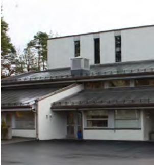
Våre nabomenigheter (s 4)

Menighetsblad for Den Evangelisk Lutherske Frikirke, Kristiansand Menighet