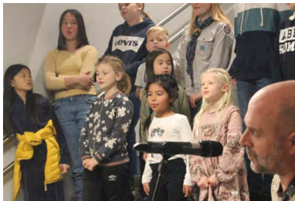
Jubilo er menighetens barnekor.

Besøktjenestens hovedmål er fremdeles å besøke menighetens medlemmer som pga. sykdom eller andre omstendigheter blir tatt avsides for kortere eller lengre perioder, samt besøk med blomsterhilsen til de som fyller runde år, 80-85-90. I tillegg får alle over 90 år besøk hver bursdag. De aller fleste gir uttrykk for at de setter pris på å få denne hilsen fra menighe-