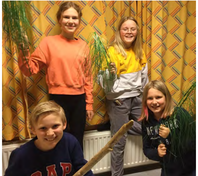
Noen av øvelsene skjer på Prestheia skole.

Det er imponerende at den faste prosjektgruppa gjennom ti år stiller på nytt. Det er egentlig ikke så rart fordi påskespillet er et utrolig flott prosjekt å være med på. For gamle og for unge.