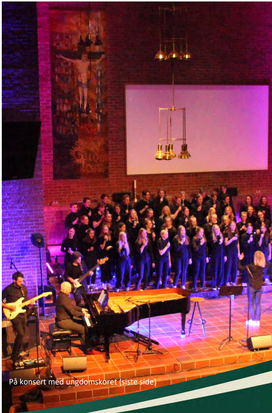
På konsert med ungdomskoret (siste side)