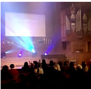
Årsmelding 2019 (s 6-14)