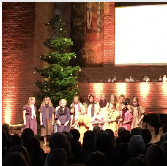
Julaften 2019. Utdrag fra «like til Betlehem».