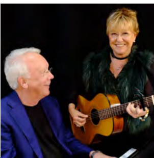
Konserter (s 15)