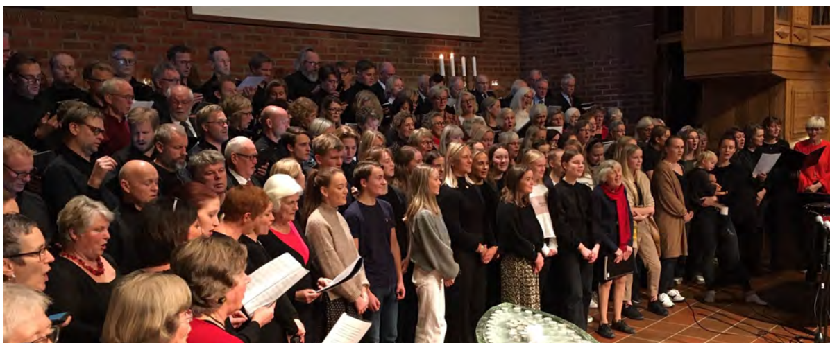
Felleskoret i adventsgudstjenesten.

I samarbeid med Oddernes og Tveit menighet gjennomførte vi i september 2019 en pilgrimsvandring fra Oddernes til Tveit kirke.