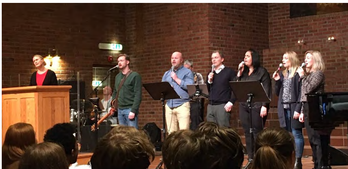
Fra en kveldsgudstjeneste.