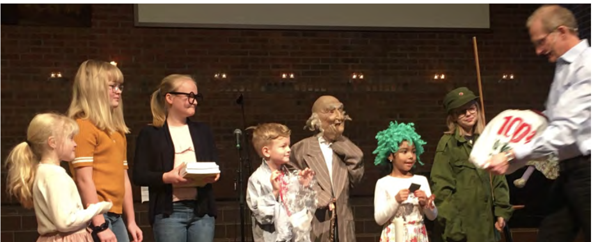
Fra en av våre familiegudstjenester.

Levende tro, Inkluderende fellesskap, Takknemlighet og Tjenestevillighet