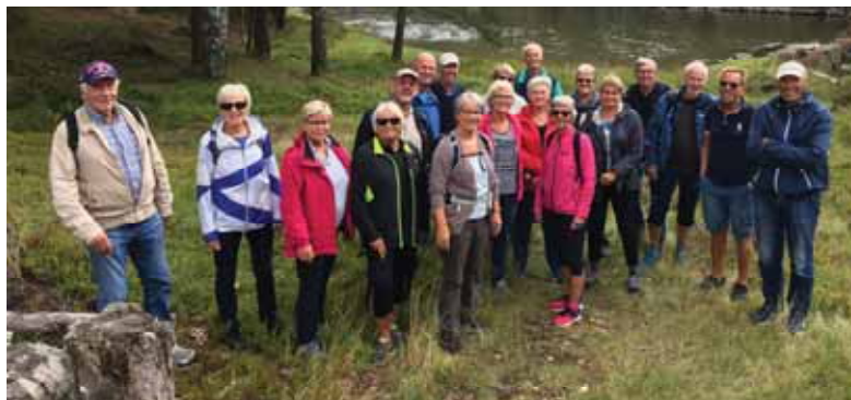
En glad turgjeng fra en av høstens turer