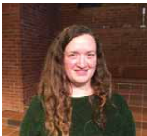
Ny eldste (s 2)

Menighetsblad for Den Evangelisk Lutherske Frikirke, Kristiansand Menighet