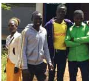
Situasjonen i Didessadalen (s 11)