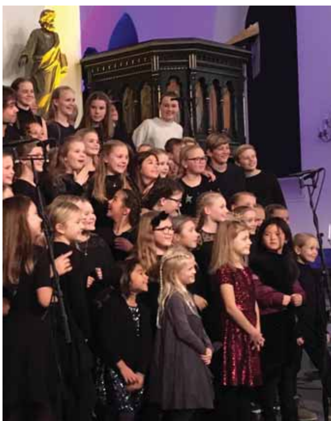
Jubilo på konserten i Domkirke

"Homecoming konsert" for de som har dradd til andre byer for å studere eller jobbe ser ut til å bli en fin tradisjon. Så venter det nye musikalske opplevelser i året vi er begynt på. Så selv om dette er skrevet på etterskudd vil vi rette en hjertelig takk til dere dirigenter og ledere som gjør dette mulig. Det er mye å glede seg over. Og jula varer jo til påske.