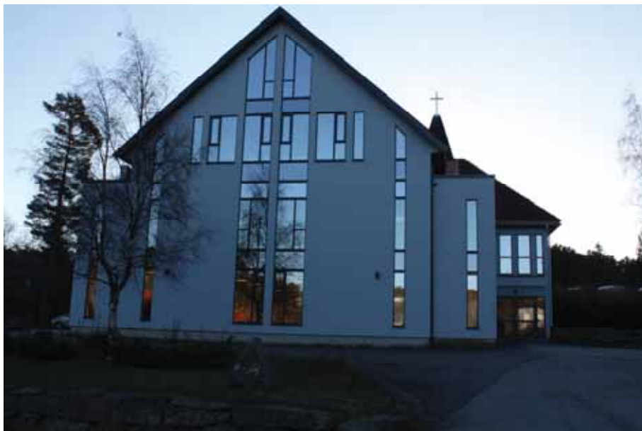
Legg merke til at vinduene i kirken er formet som et kors

Songdalen menighet har totalt 234 medlemmer og derav 112 med stemmerett. Gudstjenestene er jevnt over godt besøkt og ofte kommer flere enn 100. Men under siste konfirmasjonsgudstjeneste ble kirkesalen fylt til trengsel faktisk fire ganger. Tønnessen er opptatt av at gudstjenesten fungerer optimalt for alle generasjoner. Spesielt ønsker han å legge til rette for at flere barnefamilier kommer på søndagene.