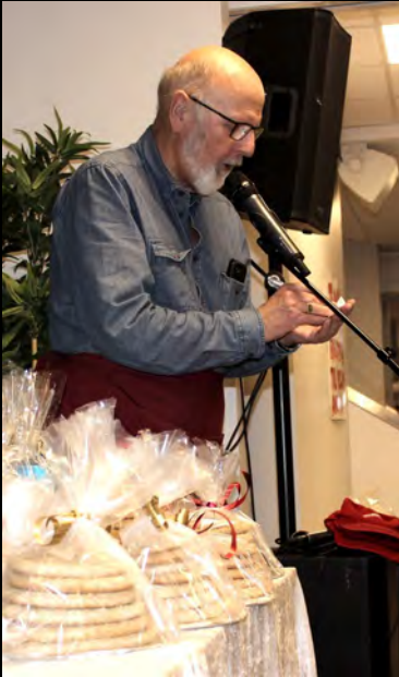
Kransekakelotteriet er ett av de mange høydepunktene.

Fra krybben til korset gikk veien for deg slik åpnet du porten til himlen for meg Velsign oss, vær med oss, gi lys på vår vei så alle kan samles i himlen hos deg