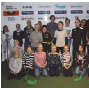
Superlight og voxlight (s 6)

Menighetsblad for Den Evangelisk Lutherske Frikirke, Kristiansand Menighet