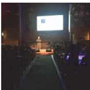
Vox (s 7)