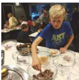
Menighetstur (s 11)