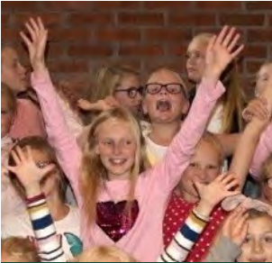
Jubilo Soul Children (s 4-5)

Menighetsblad for Den Evangelisk Lutherske Frikirke, Kristiansand Menighet