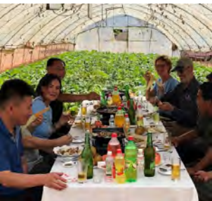
Nord-Korea (s 12)