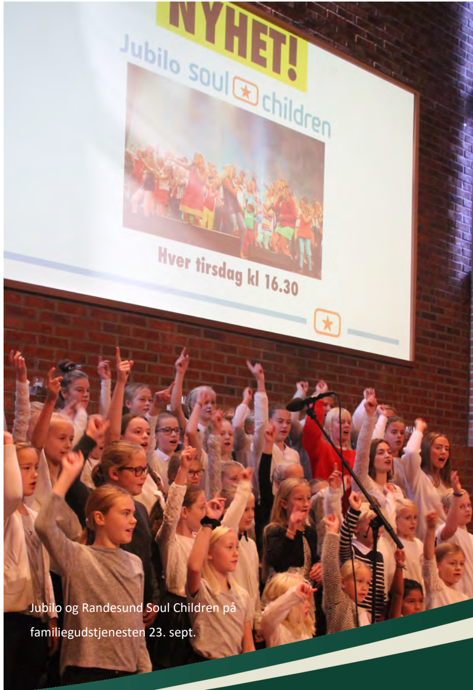
Jubilo og Randesund Soul Children på familiegudstjenesten 23. sept.