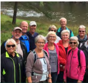
Vandreturer (s 6-7)