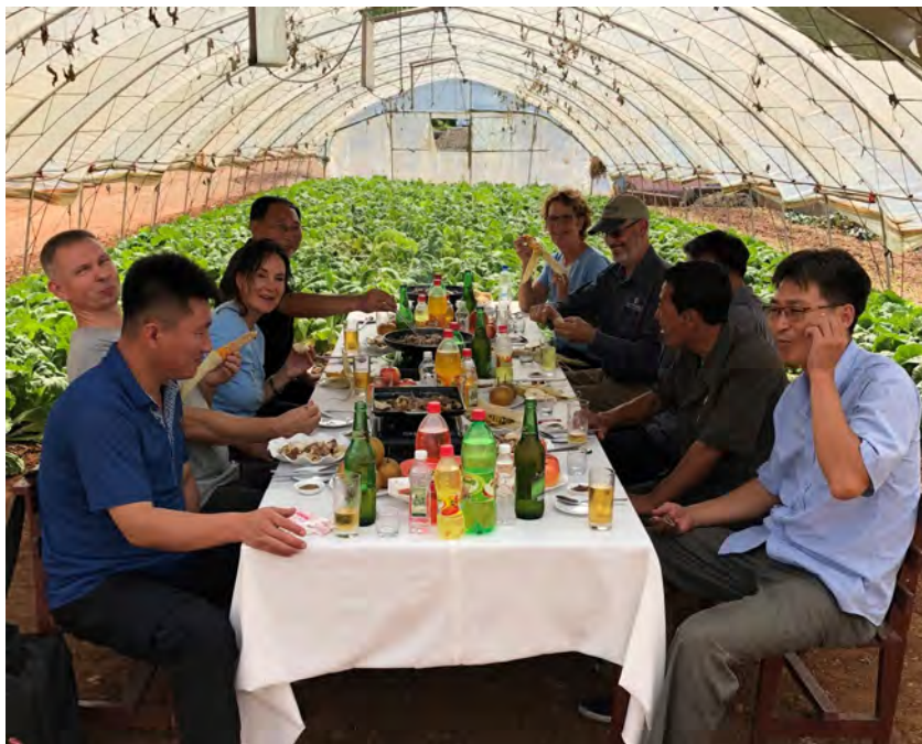
Lunsj i et av drivhusene

Myndighetene i Nord-Korea er klar over at gruppene som kommer med frø og annet utstyr til matproduksjon er kristne, men lar dem komme likevel. Vestlig statistikk anslår at to av fem nord-koreanere lider av underernæring og sult. De vestlige sanksjonene mot landet, som prøver å tvinge Nord-Korea til å oppgi