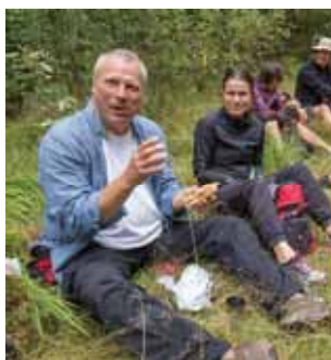
Pilegrimsvandring (S 4-5)

Menighetsblad for Den Evangelisk Lutherske Frikirke, Kristiansand Menighet