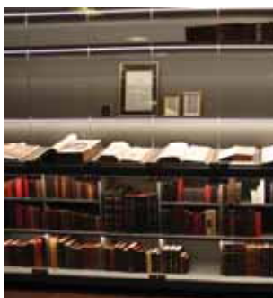
Bibelsamlingen (s 6-7)