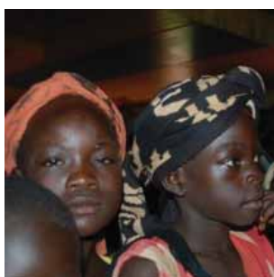
Etiopiatur (s 10-11)