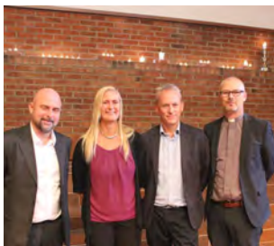
Nytt pastorteam (s 4-5)

Menighetsblad for Den Evangelisk Lutherske Frikirke, Kristiansand Menighet