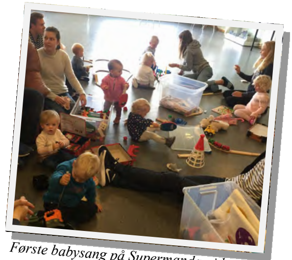
Første babysang på Supermandag i høst