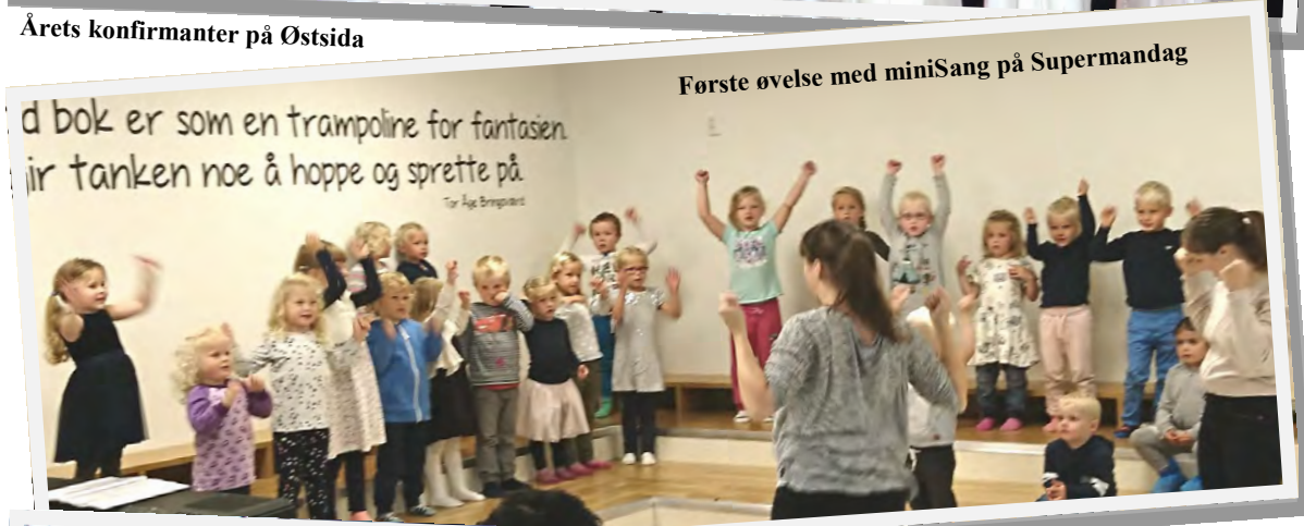
Første øvelse med miniSang på Supermandag