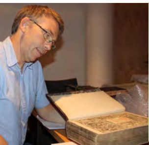
Christian III bibel (s 8-9)