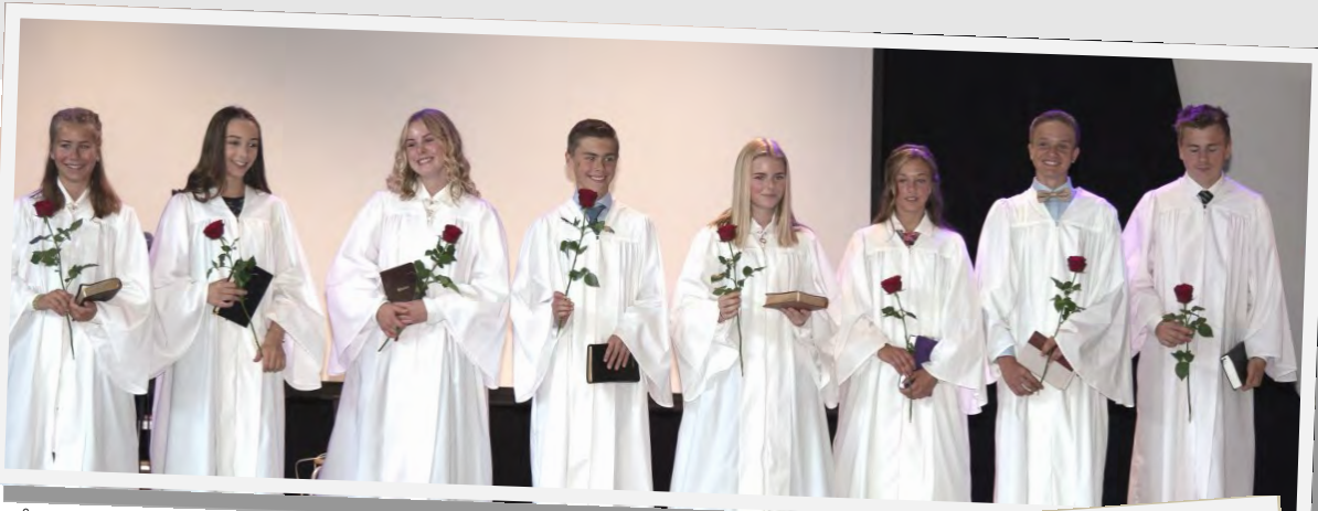
Årets konfirmanter på Østsida