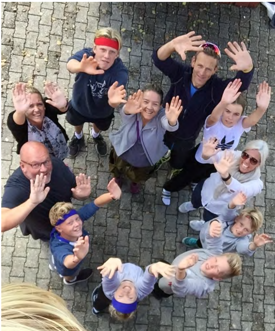
Alle tiders menighetstur til Solstrand (s 10 - 11)