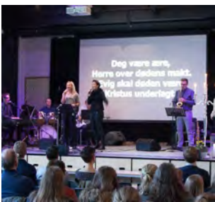
Østsida er tre år ! (s 6-7)