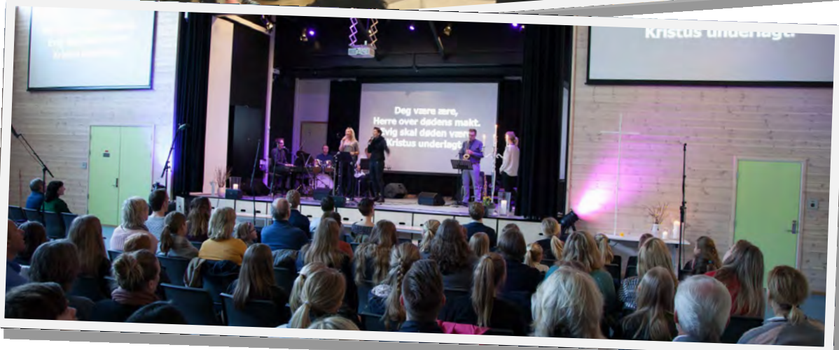
Gudstjenestene i gymsalen på Fagerholt skole