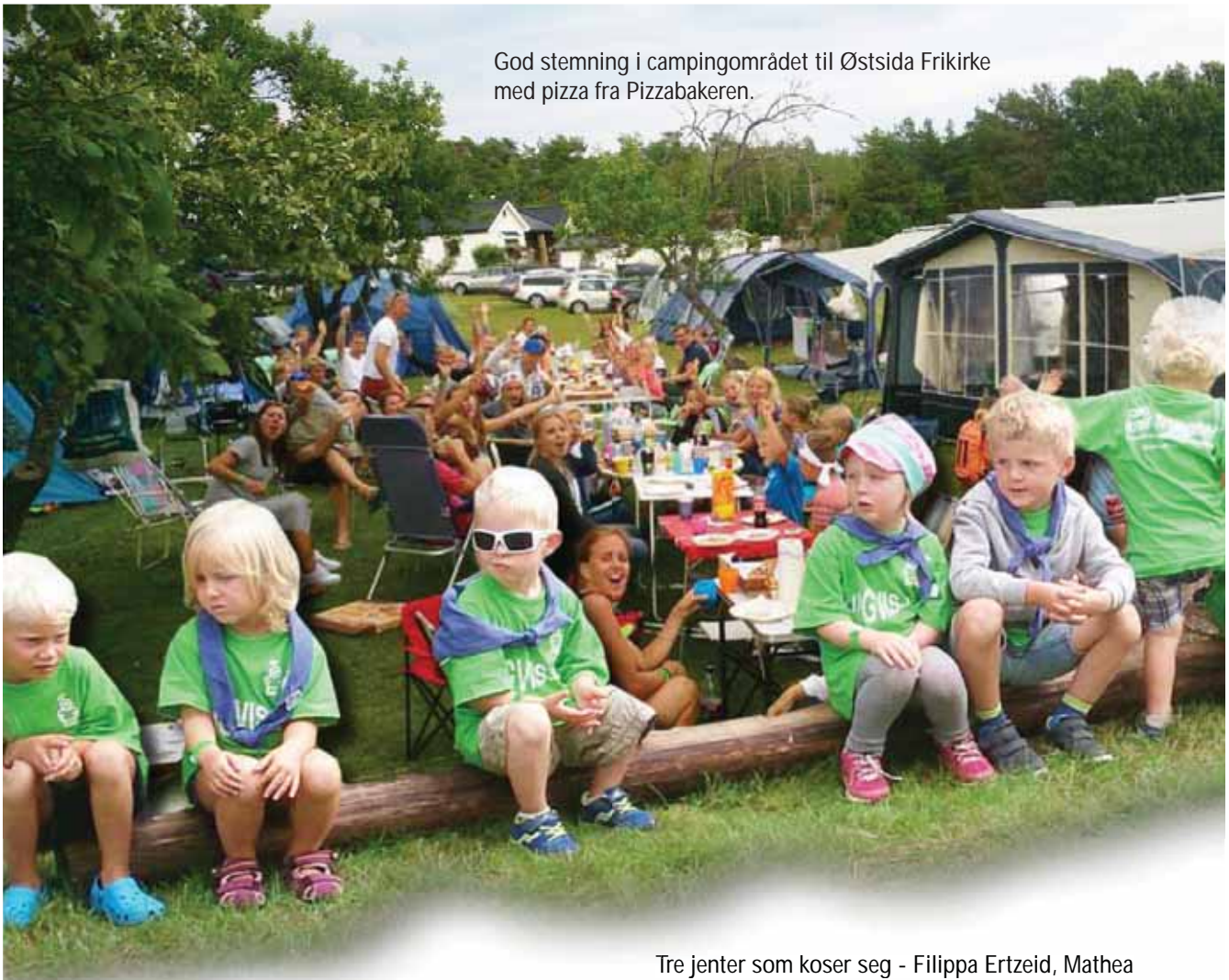
God stemning i campingområdet til Østside Frikirke med pizza fra Pizzabakeren.

Østside Frikirke var den menigheten som stilte med når menigheten enda ikke har fylt to år! Nok en gang og voksne.