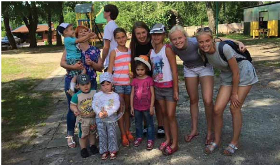
På besøk i en barnehage