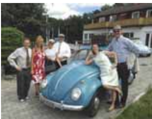
Søndagsskole tur( S - 11)