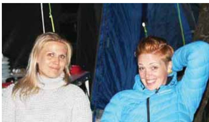
Ungdommene våre storkoste seg også på YESS.