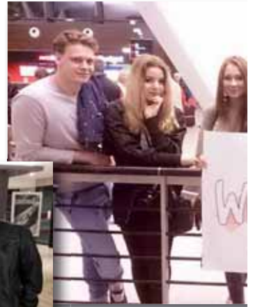
Flott velkomst fra den nye menighetsplantingen i Gdansk