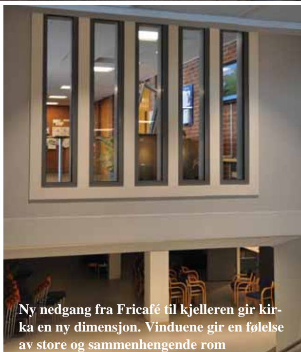
Ny nedgang fra Fricafé til kjelleren gir kirka en ny dimensjon. Vinduene gir en følelse av store og sammenhengende rom

Takk til alle som har jobbet. Mye av regningen er allerede betalt, men en del gjenstår. Mer om det til høsten.