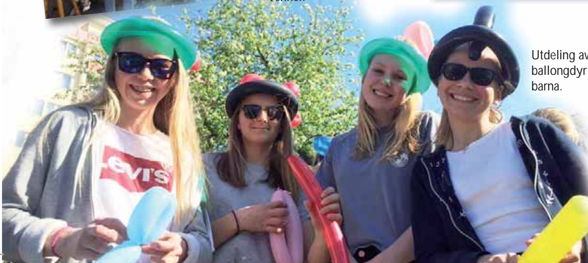
Utdeling av ballongdyr til barna.

We are here for work It is a blessing to call God true Kos