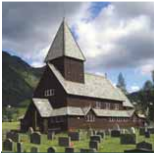
Pilgrimstur (S - 2)

Menighetsblad for Den Evangelisk Lutherske Frikirke, Kristiansand Menighet