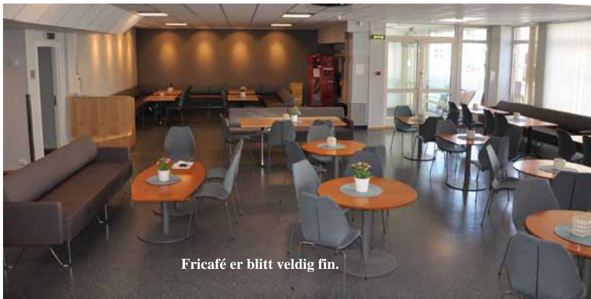
Fricafé er blitt veldig fin.