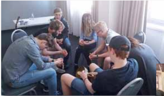
Gruppemøte med samtale og bønn.

3. - 7. mai dro 25 medlemmer fra Østside Frikirke, sammen med nabobyen til Gdansk, for å støtte et polsk menighetsplantingsprosjekt. Samtidig fikk vi bygd team inn mot ungdomsarbeid i Østside. Her er noen bilder fra turen.