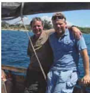
Folkehøyskolen (S 16)