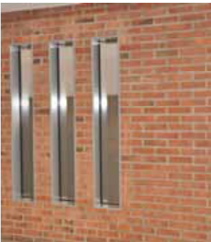
Oppussing (S - 6)