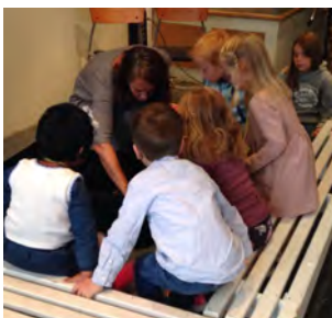
4-åringene samlet (s 4)