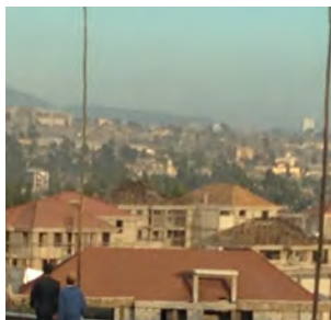
Til Nekemte (s 2)

Menighetsblad for Den Evangelisk Lutherske Frikirke, Kristiansand Menighet