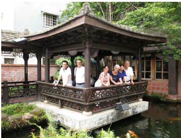
Sammen med kinesiske medarbeidere