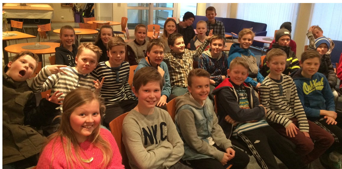
28 kule tweens samlet i Frikafé