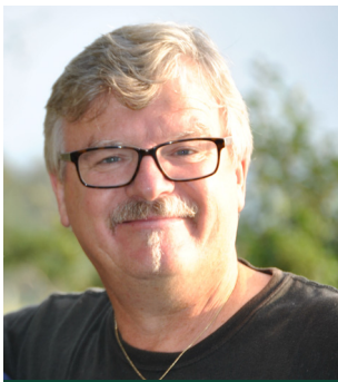
Samlivskveld (S - 8)

Menighetsblad for Den Evangelisk Lutherske Frikirke, Kristiansand Menighet