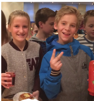
Wox Light (S10-11)