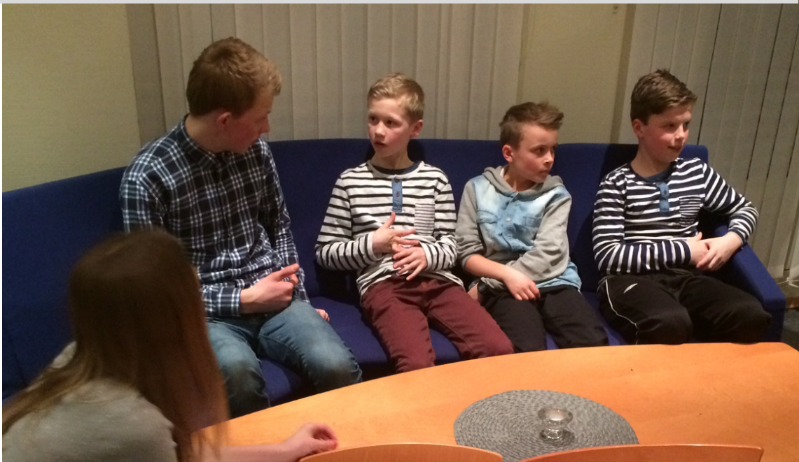
Konsentrert gjeng med Quiz