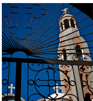
Stefanusalliansen (S 16)