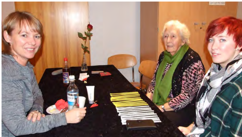
Tre generasjoner Gabrielsen samles til Misjonsmesse.

Vi gratulerer messekomiteen og alle de som hadde en hånd med i arrangementet med resultatet. Til sammen kom det inn ca 315000 blanke kroner til misjonsarbeidet i Frikirken. Og bonusen må vi kunne si er alt det som skjedde av gøy og moro hele dagen til endes.