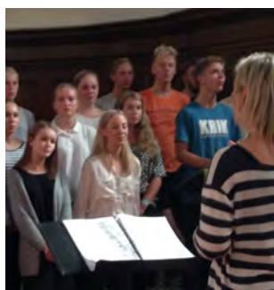
På tur til London (14)