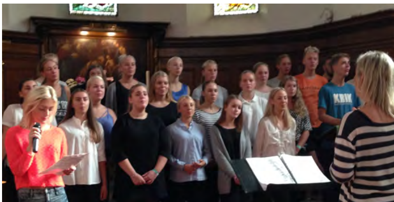
Koret varmer opp før gudstjenesten i Sjømannskirken.