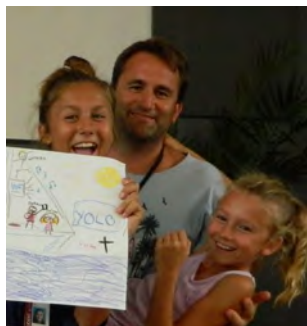
Harv på Hawaii (s 8)