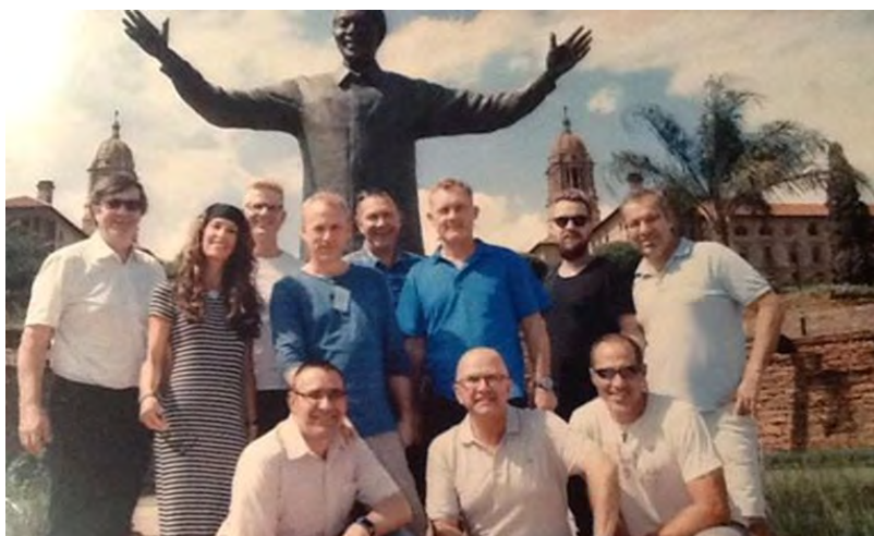
Doxa Deo, City Changers i Sør-Afrika

Er belønningen for oss kristne at vi får komme til Himmelen, eller begynner det her på jorden, ved at vi får leve et liv i Guds bilde og i tjeneste for andre? Er vi for opptatt av å tale om frelsen, at vi glemmer å undervise om