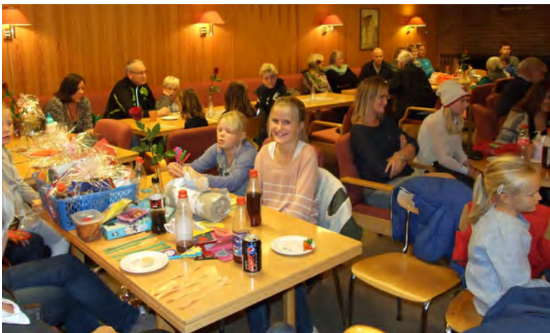
Gøy, gøy, gøy var de tre ordene som ble refrenget denne dagen