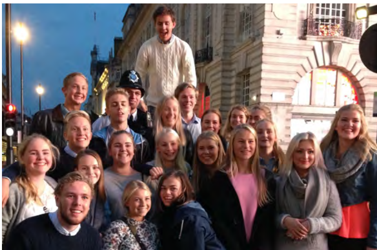
Kormedlemmene omkranser en ekte "Bobby" på Piccadilly Circus.