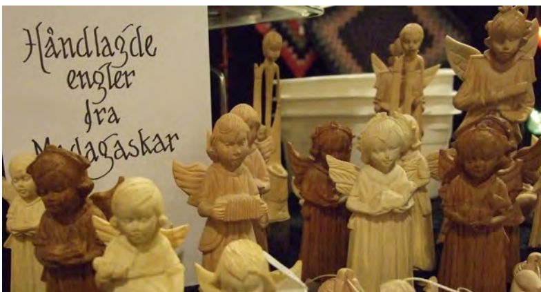
Utrolig mye fint håndarbeid var til salgs på messa. Noe kom langveis fra. Her er engler fra Madagaskar. Sikkert engler som har laget dem.