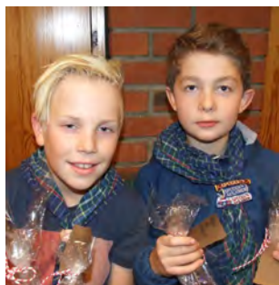
Speidere i 40 (15)