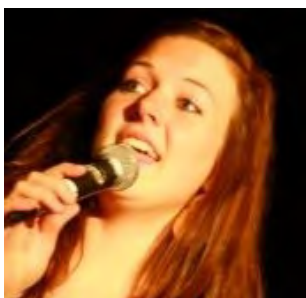
Ny Fri-BU-arbeider (s 4)