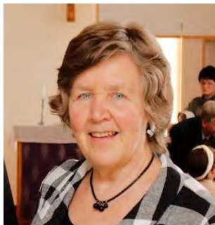
Tilbake fra Japan (s 2)

Vi ønsker våre lesere en riktig god sommer!