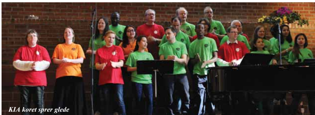
KIA koret sprer glede