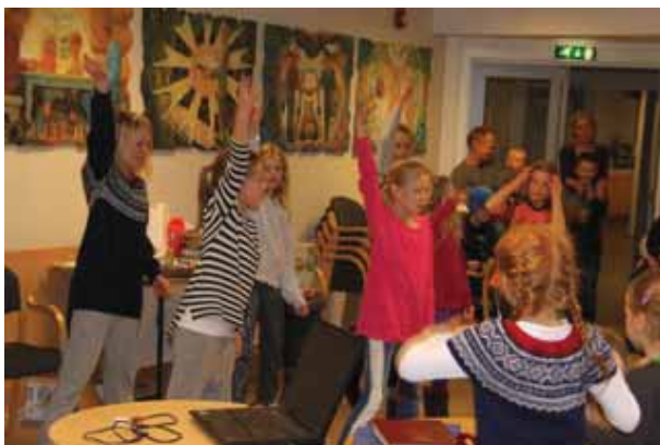
Deler av Joy opptrer på familiesamling

Første helga i vinterferien dro 80 store og små «østkantfolk» på tur til Evjetun. Det ble ei flott helg med lave skuldre og gode relasjoner, - både med Gud og med hverandre. Ski og lek samt familiesamlinger og voksensamlinger om kvelden gjorde helga til en god påfyllsstasjon på mange vis. Og så hadde vi selv-sagt BINGO, som seg hør og bør på en menighetstur.