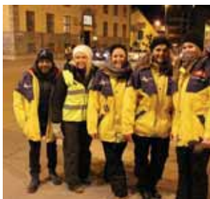
Natteravn (s 4)

Menighetsblad for Den Evangelisk Lutherske Frikirke, Kristiansand Menighet