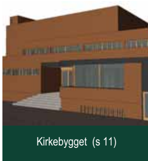
Kirkebygget (s 11)