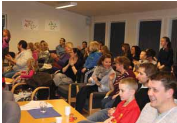
God stemning i fellesskapet!

I august skal vi tilbake til Evjetun og håper da å fylle leirstedet enda mer.