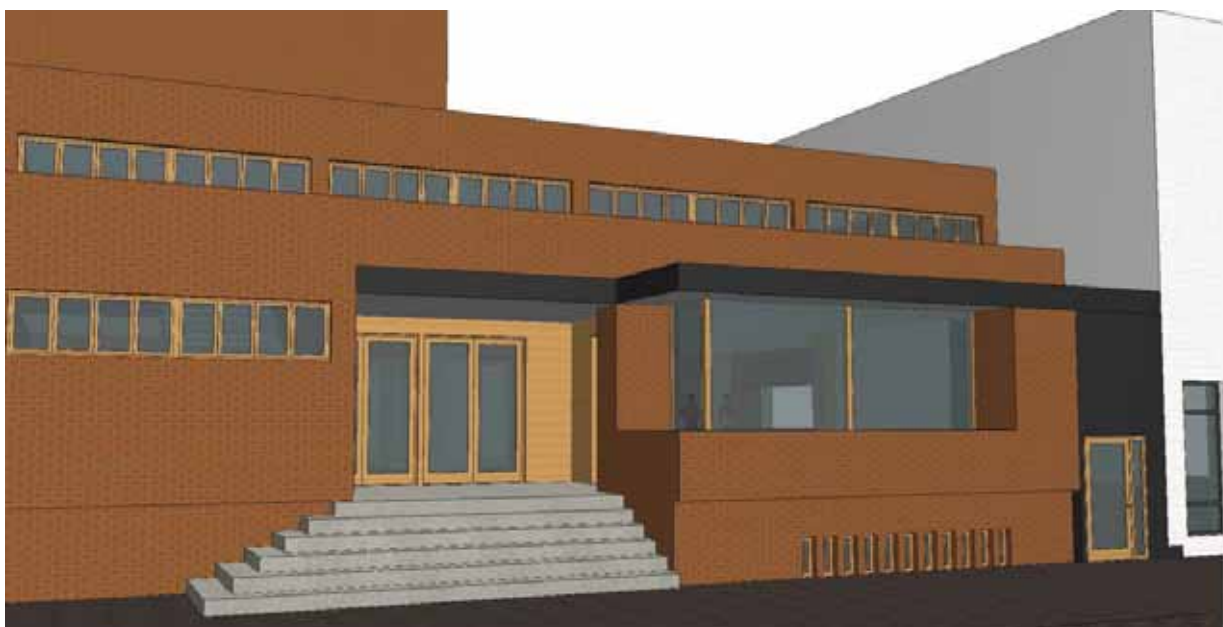
Ny fasade mot Tollbodgata

For mer informasjon se: http://www.krsandfrikirke.no/a/660/Renovering_av_bygget