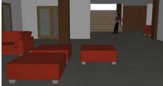
Den nye trappen sett fra kjelleren.

Byggekomitéen har som mål å foreslå løsninger som gir en åpen og innbydende kirke, samtidig som løsningene skal være både fleksible, nøkterne og mulig-