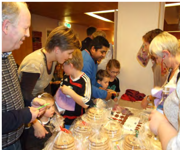
Misjonsmessa er høstens høydepunkt