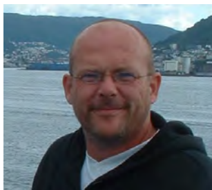
Halvveis til 100 (s 4)