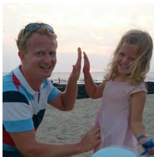
Brev fra Hawai (s 2)

Menighetsblad for Den Evangelisk Lutherske Frikirke, Kristiansand Menighet