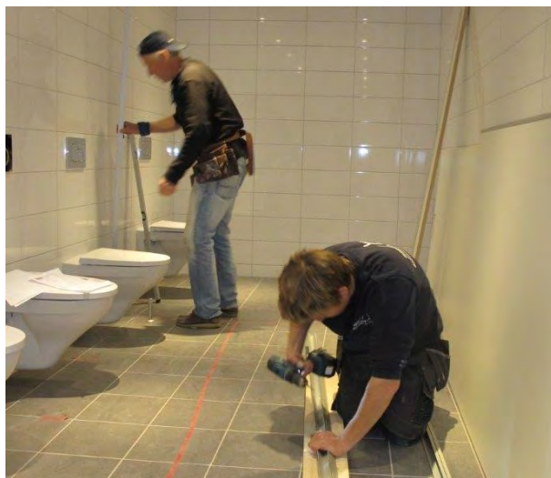
Oppussingen av det "gamle" kirkebygget er allerede godt i gang. Her er det toalettene i kjelleren som renoveres.

Ved årets begynnelse var det nylig blitt vedtatt at det ikke ble noe av planene om nytt kirkebygg. I stedet ble det fart i planene om ny menighet i østre del av kommunen. Et ALPHA-kurs på Mediehøyskolen «satte hjerter i brann», og det har vært en fryd å se det engasjementet som prosjektgruppa for Frikirken Øst har utvist. Samtidig har menigheten vist sterk støtte og raushet overfor plantingsprosjektet. I september ble det vedtatt planer for menighetsplanting innen et år.