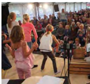
Årsmeldingen (s 10-16)