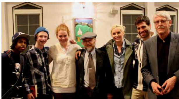
Ungdom og misjon. Her fra Japan der noen av våre unge var med på en inspirerende reise.