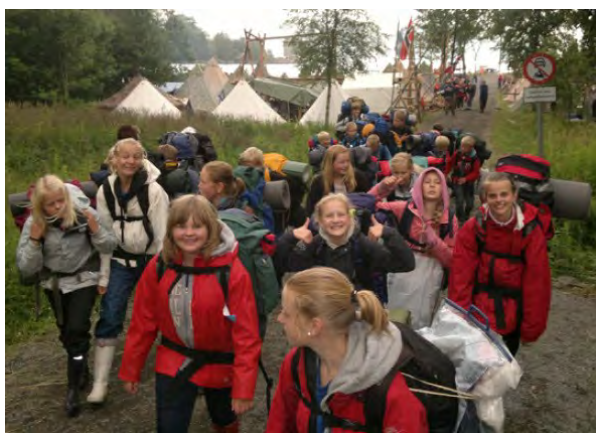
Ut på tur—aldri sur.