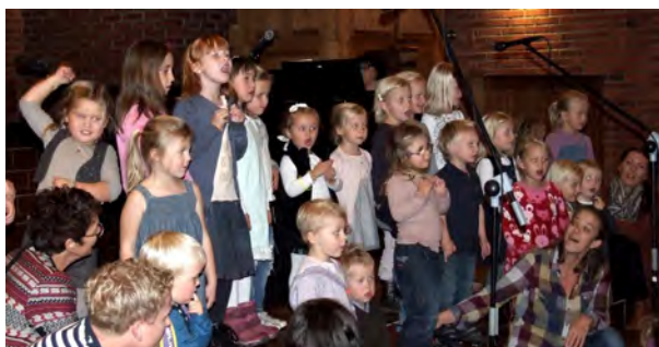
Menighetens sang og musikkliv er stort og variert. Her er Knøttekoret i aktivitet.