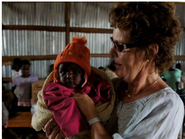
Misjonsarbeidet står sterkt i menigheten.