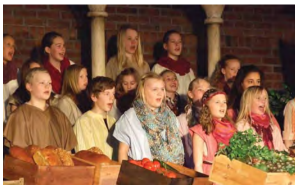
Påskespillet 2013 samlet over tusen mennesker.