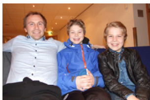
Les Miserables (s 16)