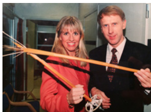
Motivasjonssamling (s 13)