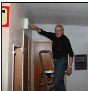
Viktig arbeid (s 10)