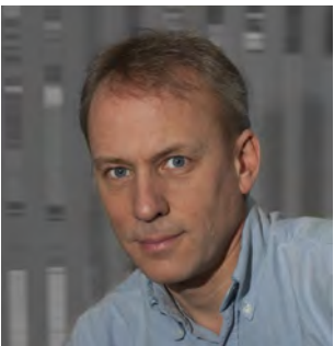
Ny administrasjonsleder (s 4)