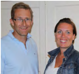
Ny menighet i 2014? (s 2)