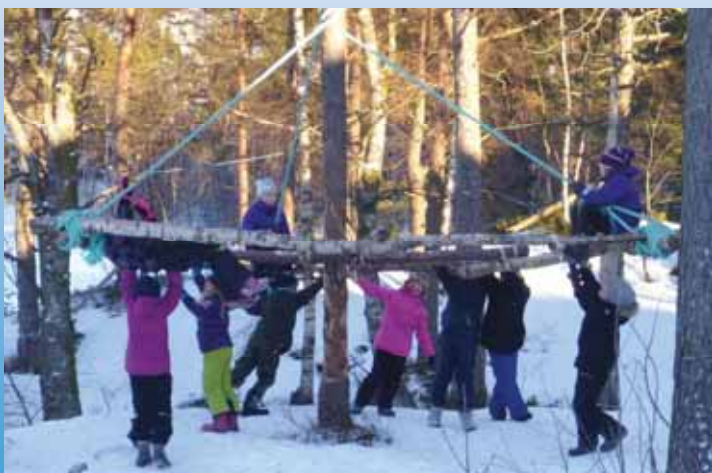
Speiderne var ute fra morgen til kveld, og en «snurretur» på speidernes egnlagde karusell er alltid gøy.