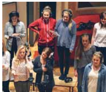
CD fra Ungdomskoret (s 8)