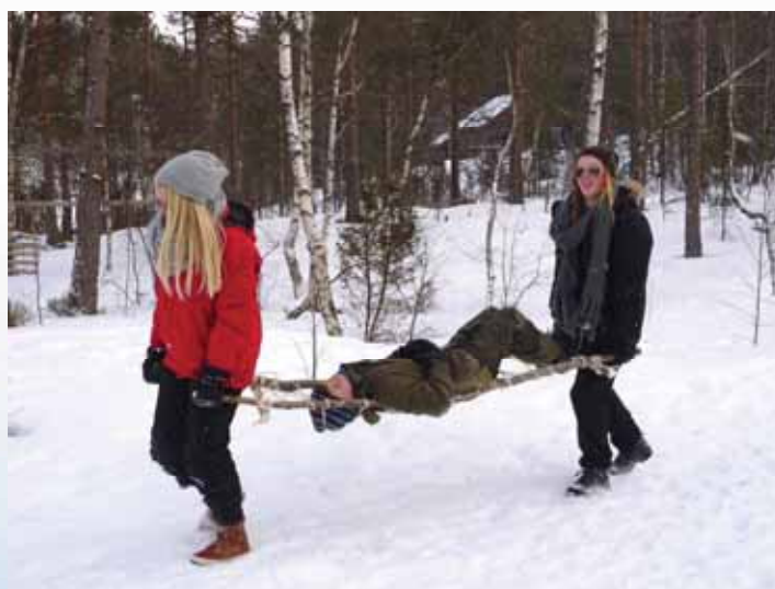
Her lages bære med hjelp av stokker og tau. Her gjelder det å surre fast og godt. Tror det var godt at pasienten ikke var hardt skadet. Men det holdt til at førstehjelpsmerket var i boks.