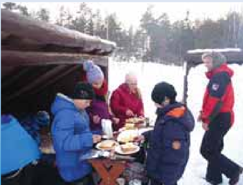
Deilig 3 retters middag ble tilberedt ute i det fri, og mange tok merket for primitiv