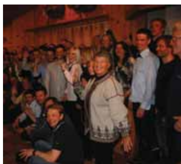
HovdenTour (s 16)