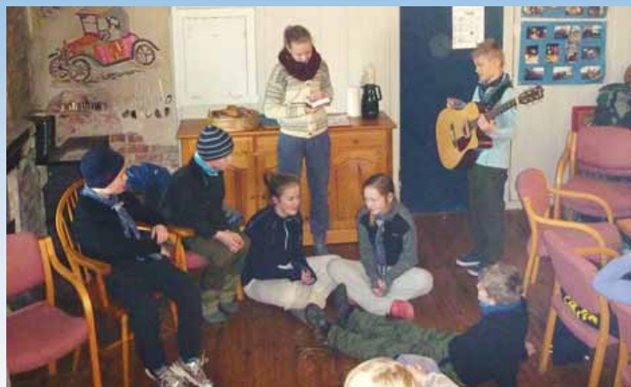
Ved å holde andakt, dramatisere og synge for sine medspeidere ble «scouts own» merket tatt.

SPEIDERMERKER I ORIENTERING, SCOUTS OWN (HOLDE SPEIDERGUDSTJENESTE FOR SINE MEDSPEIDERE), PRIMITIV MATLAGING, FØRSTEHJELP OG LIVLINEKASTING BLE TATT I LØPET AV HELGA.