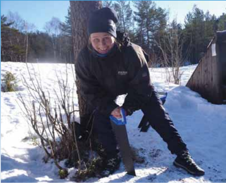
Kutting av isblokker, og egnenproduserte ispigger var også en del av aktivitetene.