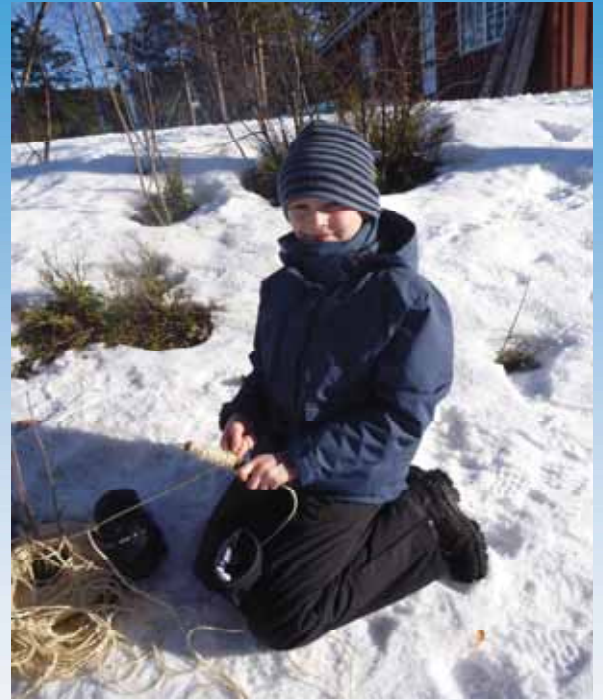
Med friskt mot i 18 minusgrader var det en gjeng av speiderne som rigget seg til for overnatting i lavoen. Det ble litt for kaldt for enkelte i løpet av natta, men 4 av speiderne sov som noen steiner natta gjennom