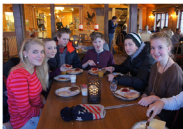
VoX på tur (s 2)