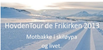
HovdenTour de Frikirken 2013 Motbakke i skiløypa og livet.