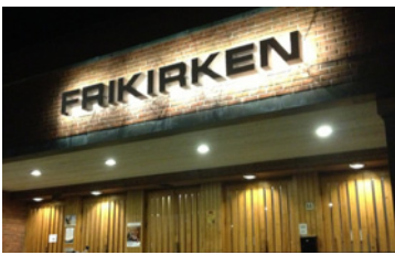
Menighetens årsmelding 2012 (s 4-23)