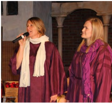
Påskespillet 5 år (s 6)