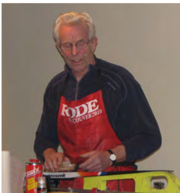
Smøretur i Frikjerka (s 16)