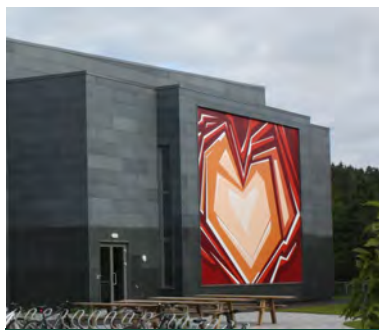
Ny Frikirke på Hånes (s. 12)