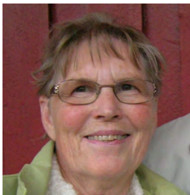
Framfor alt—tryggheten (s. 6)