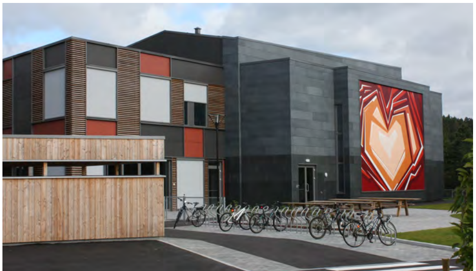
Det flotte bygget som rommer kirken og barnehagen.

Før undertegnede forlater stedet blir jeg innstendig anmodet om å overbringe en takk til Frikirken i Kristiansand for all støtte i forbindelse med etableringen av det nye bygget. Ikke minst for oppmuntring og forbønn. Han har allerede sett enkelte fra byen på gudstjenestene og ser gjerne at flere kommer på besøk.