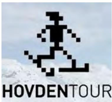
Spoke folk (s.20)