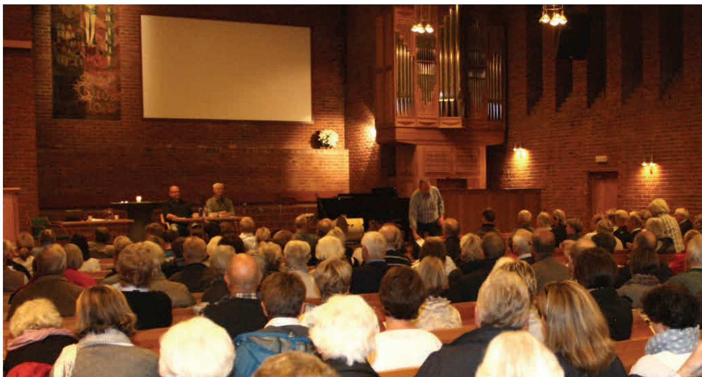
Menighetsmøtet ang salg av kirkebygg og videre planer om nybygg var meget godt besøkt.

Deretter takket menigheten nei til et tilbud fra Lunde Holding AS om en tomt på Tangen til en antatt verdi av 20 millioner kroner. Forslaget fra Lunde Holding gikk ut på at Frikirken på denne tomten skulle bygge ny kirke som ville ha ført til et kapitalbehov for nybygg for menigheten på ca 50 millioner kroner. Forslaget om å takke nei til dette tilbudet fikk 130 stemmer, mens 116 stemte mot. I debatten var omtrent like mange talere som oppfordret menigheten til å utrede Tangenplanene videre fordi den nye generasjonen trenger nye lokaler, som de som mente at den kirken vi har er god nok, men trenger noe oppussing. Disse mente også at Tangen-prosjektet blir for dyrt.