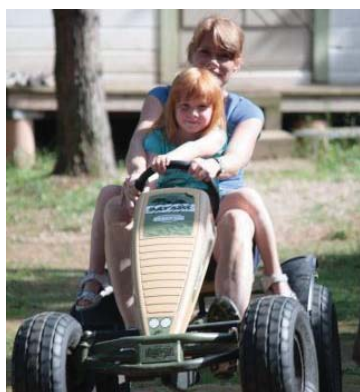
Latviateam (s 6-7)