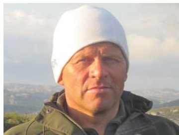
Månedens hjelper (s 2)