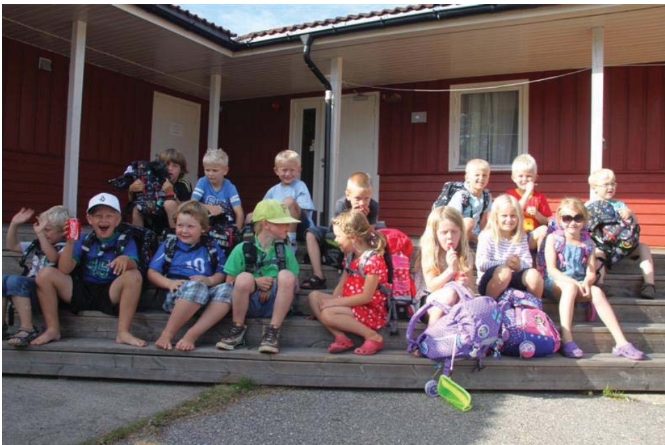
Alle skolebarna klare for samling på trappa

Det er noe eget med å reise på leir, - man blir kjent på en annen måte enn om man bare treffes en time i uka. Selv om noen hadde grudd seg litt til leiren fordi de ikke kjente så mange, var det før hjemreise for eksempel flere som hadde lyst til å prøve seg på guttis igjen, - nå kjente de jo flere som også gikk der! Trygge relasjoner er viktig når man er 6 år og når man er 60 år, og vi håper å kunne være med å stimulere til flere slike relasjonsbyggende