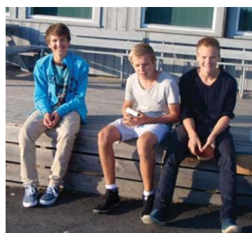
Konfirmantleir (s 16)