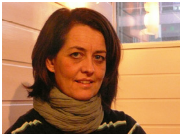
Ny eldste (s 4)