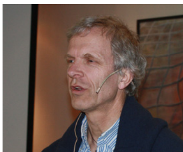
Benestad hos seniorene (s 8)