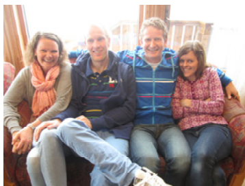
På ektepar-weekend (s 9)