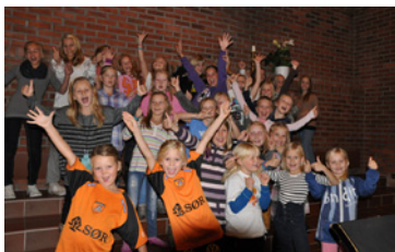
Jubilo - en glad gjeng (s 10 - 11)