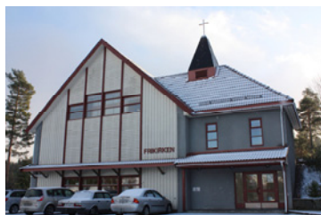
Nabomenighet i vest (s 9)