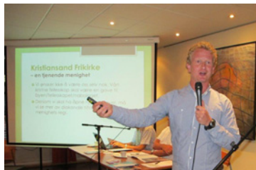
Pastortanker for 2012(s 6)