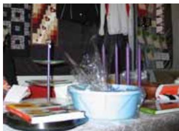
Misjonsmesse (s 16)