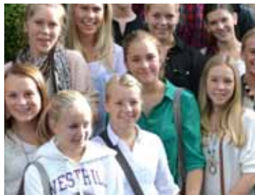
Londonetur (s 10-11)