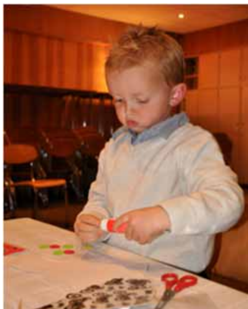
Ola i dyp konsentrasjon