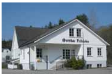
Nabomenigheter (s 12)