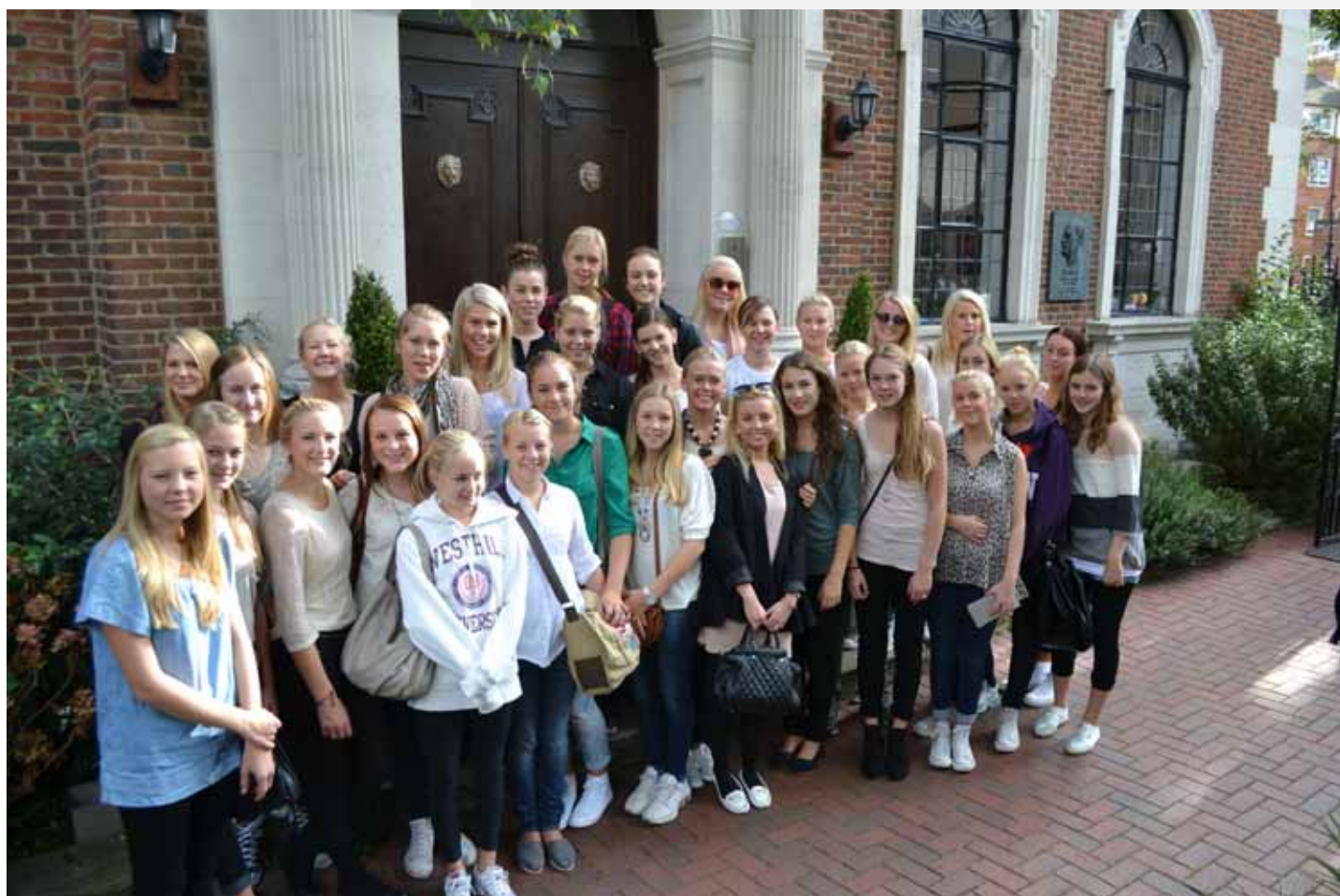
Ungdomskoret utenfor Sjømannskirken i London