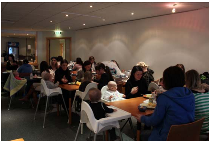
Gratis middag smaker alltid godt

Vi ønsker at mødretreffet skal være et sted hvor mød-