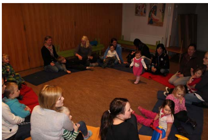
Samlingsstund for de største barna

den ros, støtte og oppmuntring de kan få.