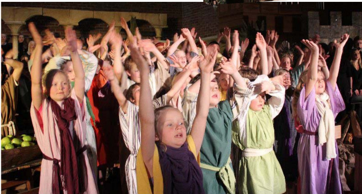
"Lys, lys levende" er barnas tilsvar på Jesu oppstandelse