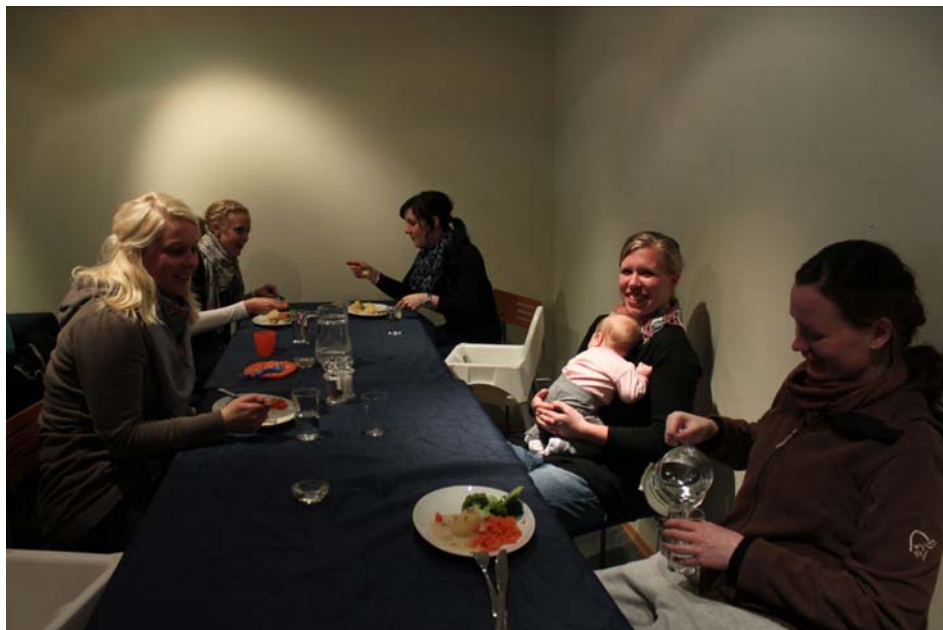
De frivillige lader opp til dagens økt.

Målsettingen for tiltaket er at det skal være kompetansehevende og nettverksbyggende. I 2008 var vi med i et aksjonsforskningsprosjekt på UiA hvor