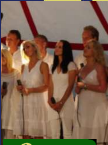
f Side 2 Sommer på Tangen

Menighetsblad for den Evangelisk Lutheraner Frikirke, Kristiansand Menighet