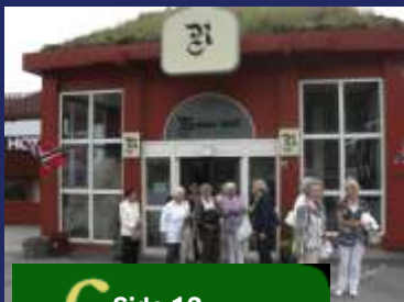
f Side 12 Sommertur