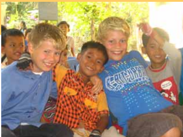
GØY MED NYE VENNER !