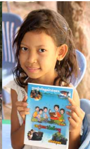
GLADE KAMBODSJANSKE BARN SOM HAR FÅTT BARNEBIBLER.