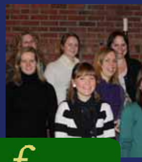
f Krydderkor (s 9)