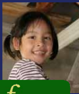
f Fasteaksjonen (s 7)