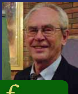
f Besøk av Nor- lander (s 2)