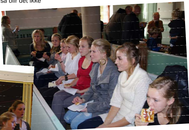
Østre Frikirke spanderte pizza på koret etter gudstjenesten

Det er faktisk utrolig hvor fort 18 jenter kan dusje, spise frokost og legge en perfekt "foundation" når tida på et kjøpesenter er begrenset til rundt fire timer. Klokka halv ti sto jentene og trippet ved bilene med lommeboka i utgangsposisjon. Etter fire timer på Sandvika storsenter var ungdoms-