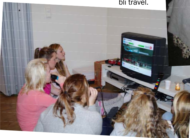
Jentene viste et imponerende nivå i "singstar"

rydding og kirkevasking før jentene kl. 10 står klare og synger seg opp i Østre Frikirke. Koret preget gudstjenesten med nydelig sang og pastor Johannesen, som umiddelbart ville avtale nytt besøk med koret, sammenliknet koret med englebildet han hadde over senga som liten! Fin gjeng på tur!!!