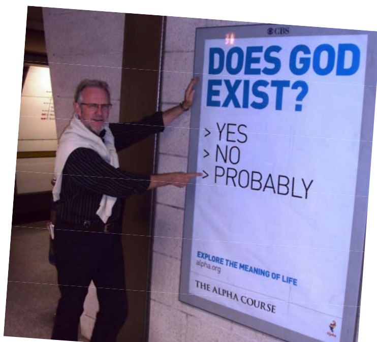
Vi besøkte menigheter i London som når ut i storbyen, blant annet hadde Holy Trinity Brompton, menigheten der Alphakursene startet, kjøpt plass på busser og T-baner for sine nye kurs.