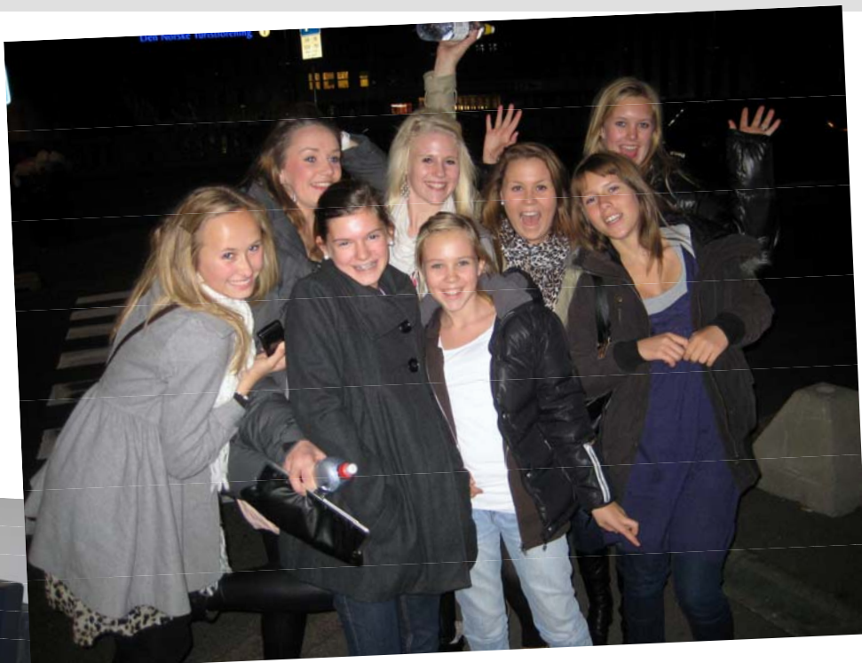
MAMMA MIA – Here we come!!

Etter en del pølser, "singstar", prat og kos var det natta, for neste dag skulle bli travel.