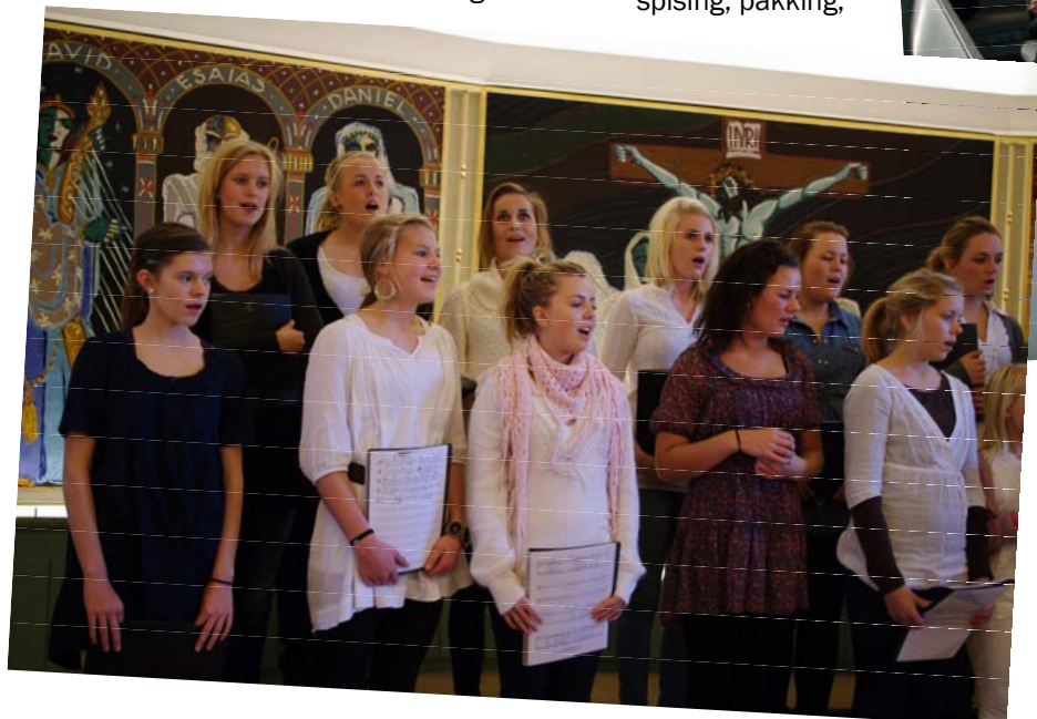
Flotte jenter med vakker sang