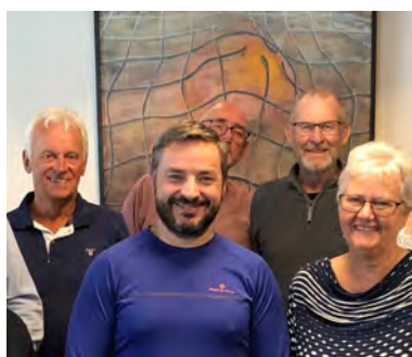
Frikontakt og Ukraina (s 16-17)