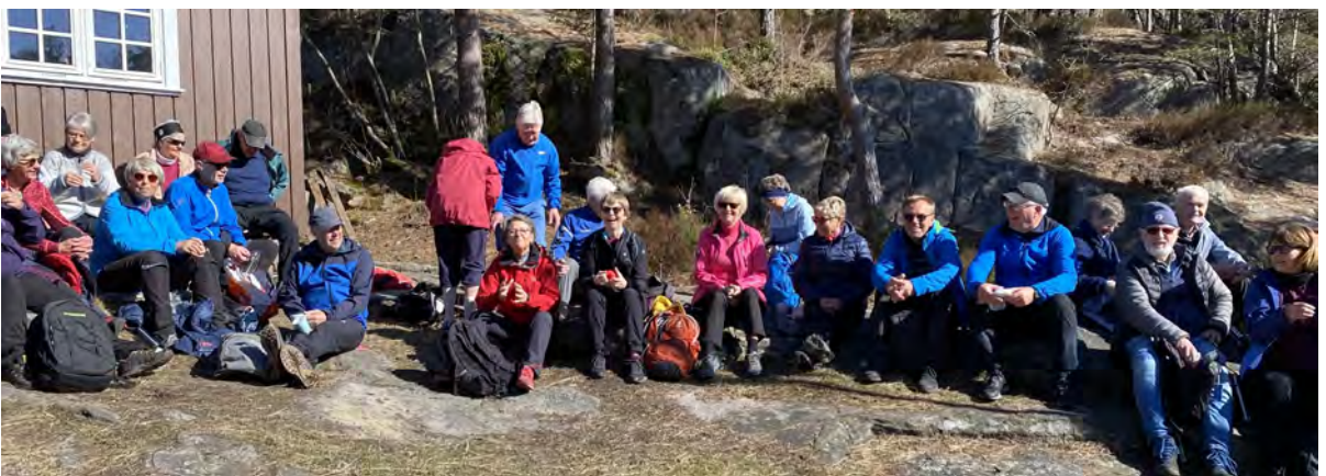
Vågsbygdspeidernes hytte ved Talbuvannet, et ypperlig turmål

I juni dro vi i vesterveg til Hålandsheia i Mandal. Målet var å komme til toppen, men med en stigning på nesten 100 meter var det ingen sure miner. På toppen ble vi belønnet med vakker utsikt i alle retninger og i vest kunne vi skimte Lindesnes. Bra vær tillot å ha kaffepausen på top-