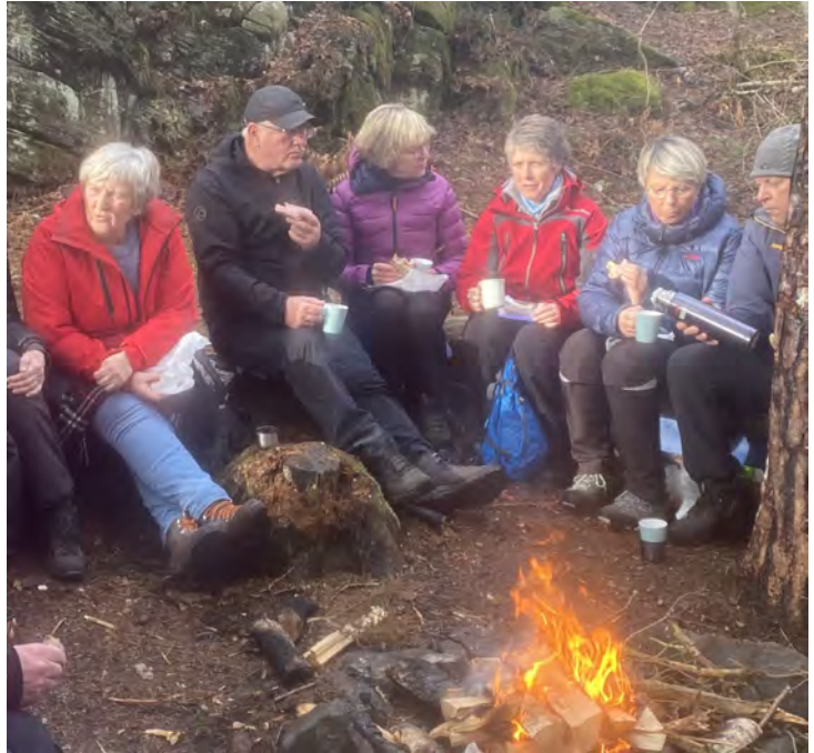
Bålkos på Flekkerøya