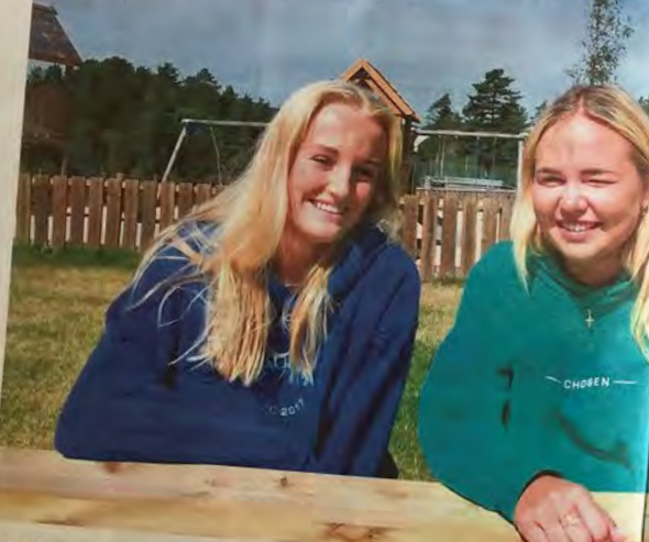
LEIR: Konfirmanter fra de ulike frikirkemenighetene i Agder har vært på leir. Særlig én ting lykkes de med.

LIKE MANGE LEDERE SØN DILTAKERE Tredag til onsdag var 64 konfirmanter fra ulike Frikirker på landsdelssamling i Agder. Det var 24 konfirmanter fra Kristiansand, 24 fra Flekkefjord og 16 fra Tvedestrand. De ble samlet i Kristiansand for å delta på TØFF-kurset.