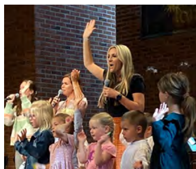
På tvers av generasjoner (s 24)