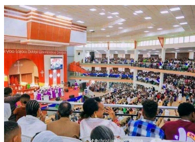
Nakamte 100 år (s 18-19)