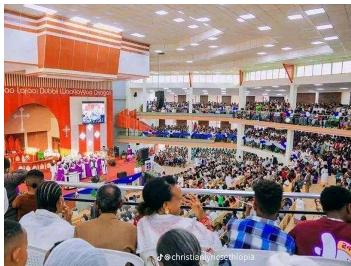
Den nye kirken