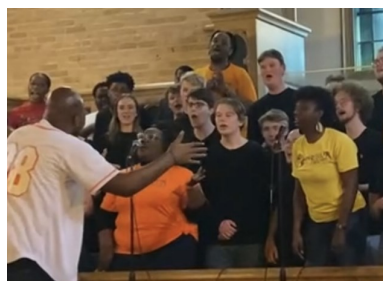
På tur til New Orleans (s 2)